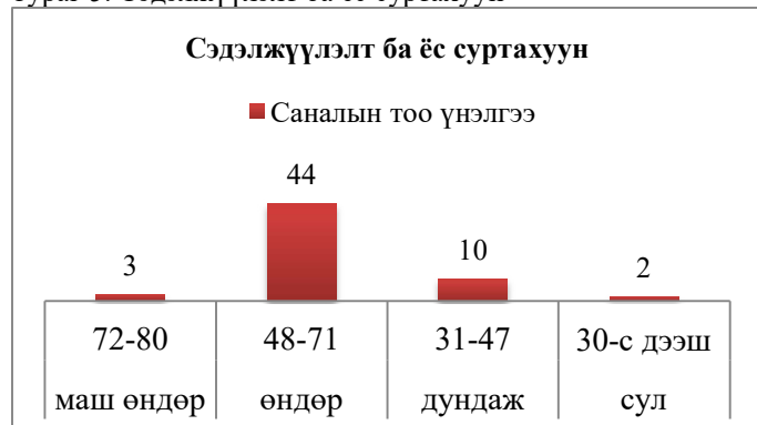
Зураг 5. Сэдэлжүүлэлт ба ёс суртахуун