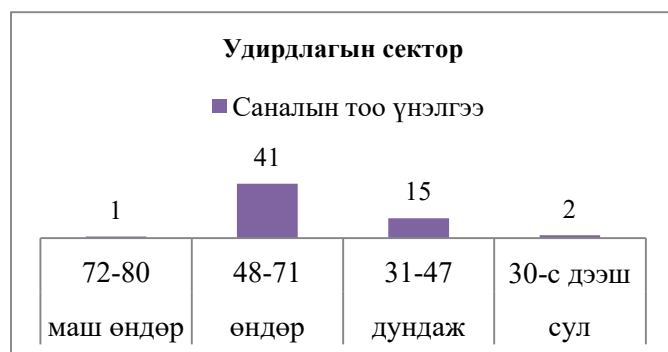
Зураг 4. Удирдлагын сектор

Судалгааны энэ хэсэгт харилцаа холбооны секторын ерөнхий түвшин өндөр үнэлэгдсэн. Үүнээс маш өндөр үнэлгээ 8.4 хувь, өндөр үнэлгээ 71.1 хувь, дундаж үнэлгээ 18.6 хувь, сул үнэлгээ 1.7 хувийг тус тус эзэлсэн. Харилцаа холбооны хэмжүүрийг тодорхойлох асуултууд 7.1-7.4 оноотой, тухайн компани маш сайн харилцаа холбоотой, мэдээлэл дамжуулалт сайн хүндрэл багатай, харилцаа холбооны арга хэрэгслийн ашиглалт сайн гэж дүгнэгдлээ.