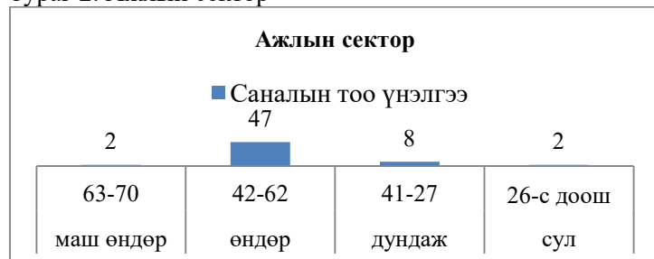
Зураг 2. Ажлын сектор

Байгууллагын соёлын түвшинг сорилын аргаар үнэлэх судалгааны үр дүнгийн дундаж оноо 200.1 буюу соёлын түвшин өндөр гэж үнэлэгдсэн. Тус бүрд нь задалж харуулбал соёлын түвшин маш өндөр буюу 265 оноо, соёлын түвшин өндөр буюу 213 оноо, дундаж соёлтой буюу 153 оноо, сул соёлтой буюу 88.5 онооны үнэлгээг тус тус өгчээ.