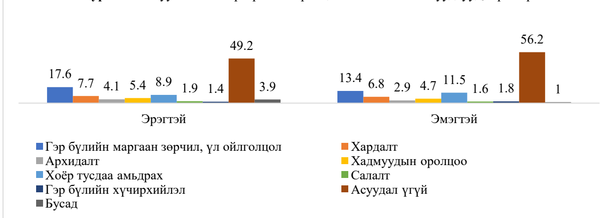
Зураг 3.2 Залуу малчны гэр бүлийн харилцаатай холбоотой асуудлууд, хүйсээр

Аймаг, сумын ЗДТГ-ын мэргэжилтнүүдтэй хийсэн ганцаарчилсан ярилцлагаар залуу малчин гэр бүл үр хүүхдүүдээ сургуульд суулгахаар ээж нь төв суурин газарт, аав нь хөдөө малаа маллаад амьдарч байна. Ингэснээр залуу малчин ээжүүд мал аж ахуйгаасаа хөндийрөх хандлага ихсэж байгаагаас гадна үүнтэй холбоотойгоор гэр бүлийн зөрчил, үл ойлголцол бий болж гэр бүл салалтыг нэмэгдүүлэх эрсдэлийг дагуулж байна. Мөн эмэгтэйчүүд мал аж ахуйгаа эрхлэх нь багассаны улмаас нэгж малаас авах бүтээгдэхүүн үйлдвэрлэл төдий хэмжээгээр буурч байна. Эмэгтэйчүүд нь эрэгтэйчүүдийг бодвол ямар нэгэн боловсрол эзэмших байдал харьцангуй давуу байдгаас мал маллан амьдрах эмэгтэйчүүдийн тоо цөөрч байна.