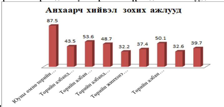
График 2. Зөрчигдөж буй зарчмын хүрээнд хийх ажлуудын графикаар