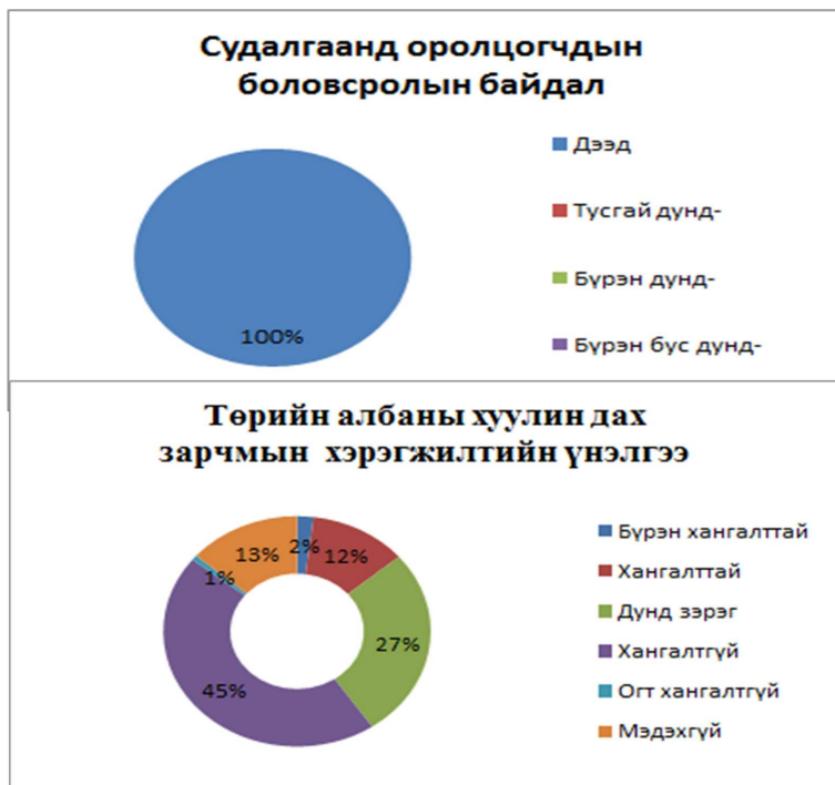
График 5. Төрийн албаны хуулин дах зарчмын хэрэгжилтийн байдал

Судалгаанаас үзвэл, төрийн албаны томилгоонд эрх мэдэл бүхий этгээд хамаатан садан, найз нөхөд, танил талдаа албан тушаалын давуу байдлыг бий болгож буйг оролцогчдын 87,5 хувь дүгнэсэн бөгөөд энэ нь төрийн албаны мэргэшсэн тогтвортой байдлыг алдагдуулж улмаар төр иргэний хоорондын итгэлцэл сулрах, харилцаанд таагүй үр дагаврыг авчрах өндөр магадлалыг харуулж байна. Мөн түүнчлэн Монгол Улсын иргэн төрийн алба хаах адил тэгш боломжоор хангагдах зарчим 45,8 хувь, ил тод байх зарчим 41,6 хувь зөрчигдөж байна хэмээн үзсэн байна Энэ нь иргэдийн төрд алба хаших эрхийг зөрчиж буй хэрэг.