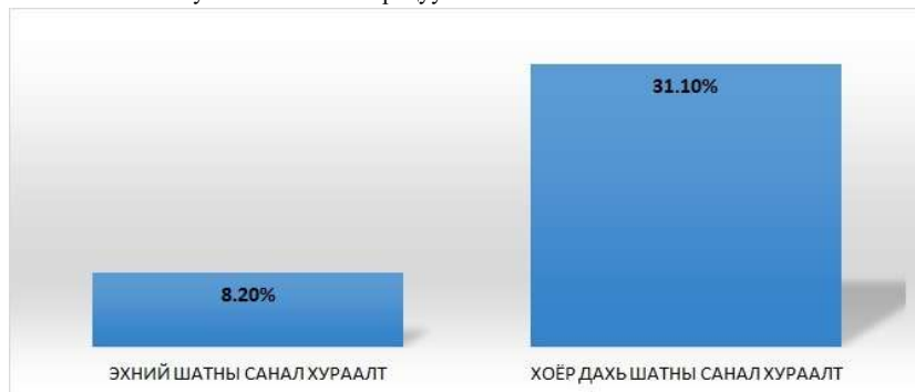
График 3. Перу улсын Ерөнхийлөгчийн 2000 оны сонгуулийн хоёр шатны санал хураалт дахь хоосон саналын хувийн жингийн харьцуулалт

Ийнхүү Ерөнхийлөгч асан Альберто Фужимори олон улсын сонгуулийн ажиглагчдын хурц хараанд онилогдсон цаг хугацааг өрсөлдөгч Алехандро Толедо соргоогоор ашиглаж, төрийн хяналтаас түр хугацаанд “чөлөөлөгдсөн” хувийн мэдээллийн хэрэгслүүдэд санхүүгийн хувьд нөлөөлж, нийт иргэдэд цагаан сонголт хийхийг эрчимтэй уриалж эхэлжээ. Ингэхдээ салбар бүр дэх төрийн хатуу хяналт, авлигын асуудал, сонгуульд нөлөөлөх гэсэн оролдлогуудыг эсэргүүцэж, хоосон санал өгөхийг нийгмийн нөлөөлөгчид болон сэтгүүлчдээр дамжуулан уриалах болсон байна. Ийнхүү Перугийн Ерөнхийлөгчийн 2000 оны сонгуулийн хоёр дахь шатны санал хураалтын дүн гарахад нийт саналд эзлэх хоосон саналын хуудасны тоо 31 хувийг давсан нь График 3 “Зохион байгуулалттай эсэргүүцлийн санал” ажиллагааны тод жишээ болж байна. (GD., 2002)