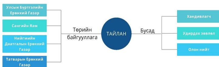
Зураг 1. Төрийн бус байгууллагын тайлан гаргаж буй байдал

ТББ-ын тайлантай танилцаж, дүн шинжилгээ хийх нь тэдгээрийн ач холбогдол, үнэ цэнийг мэдэх, тэдэнд тулгарч буй бэрхшээлийг тодорхойлох, үйл ажиллагааны чиглэлээр нь ангилж,