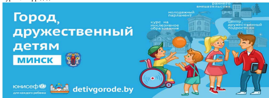
Зураг 3. Хүүхдэд ээлтэй хот Минск