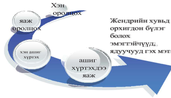
Матриц 1. БНМ-д оролцооны болон нийгэм жендэрийн судалгааг хийхдээ хамтлагийн түвшинд

Оролцооны судалгааны үйл явц нь зөвхөн нийгмийн олон янзын дүр үүрэг бүхий хүмүүсийг оролцуулах явдлыг чиглүүлэхээс гадна нийгмийн олон янзын ялгаатай бүлгүүдийн үр нөлөөг ойлгож түүнд тохирсон бодлого, арга хэмжээг хэрэгжүүлэхэд дэмжлэг үзүүлэх учиртай. Энэ бүх үйл явц, процесс нь оролцооны хяналт шинжилгээ үнэлгээнд тулгуурласан байхад чиглэгдэх бөгөөд ялангуяа нийгмийн ялгаатай бүлгүүдэд судалгааны үр дүнд тулгуурлан дэмжлэг үзүүлэх, дэмжих арга замыг эрэлхийлэхэд чиглэнэ.