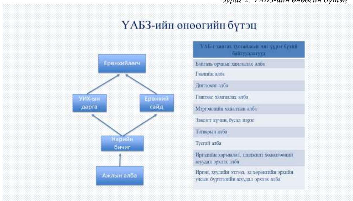
Зураг 2. ҮАБЗ-ийн өнөөгийн бүтэц

МУ-ын хувьд 1992 оны 5 дугаар сарын 29-нд Улсын Бага Хурал МУ-ын Үндэсний аюулгүй байдлын Зөвлөлийн тухай хуулийг баталж Үндэсний аюулгүй байдлын Зөвлөлийг байгуулсан. Зөвлөлийн анхдугаар хуралдаан 1992 оны 8 дугаар сарын 8-нд болж, түүгээр Зөвлөлийн нарийн бичгийн даргыг томилох тухай, Зөвлөлийн ажлын дотоод журам болон Зөвлөлийг мэдээллээр хангах журмын төсөл зэрэг асуудлыг хэлэлцэн баталсан байдаг (ҮАБЗ-ийн тухай, 2018). Улмаар 2001 оны 12-р сарын 27-ны өдөр МУ-ын УИХ-аас Үндэсний аюулгүй байдлын тухай хуулийг баталж, уг хуулийн 17.1-т “Үндэсний аюулгүй байдлыг хангах төрийн бодлого, үйл ажиллагааг төрийн нэгдмэл бодлогод нийцүүлэн уялдуулан зохицуулах чиг үүргийг Зөвлөл хэрэгжүүлэх” гэсэн заалт оруулж өгчээ (Үндэсний аюулгүй байдлын тухай, 2001). Ингэснээр ҮАБЗ аюулгүй байдлын нэгдмэл бодлогод хяналт тавих асуудлаар зохих хэмжээний эрх мэдэлтэй болсон байдаг.