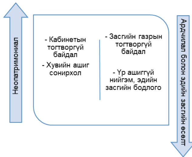
Зураг 2. Неопатримониал хэв шинж ба ардчилал, эдийн засгийн өсөлтийн харилцан хамаарал

Неопатримониал төрийн үед төрийн чадамж буурснаар сул төр бий болдог. Энэ тухай Ф.Фукуяама улс төрийн тогтолцооны ялзрал номондоо чанартай төр, эдийн засаг нийгмийн амжилт хоёрын хооронд маш хүчтэй шалтгаант холбоо байдаг. Хэлсэндээ хүрч байгаа, хүлээн зөвшөөрөгдсөн данхар төр, авсаархан ч гэсэн цаг ямагт элдэв хүлээсэнд баригдан тээнэгэлзсэн, бодит эрх мэдэлгүй төрөөс илүү амжилттай хэмээн дурдсан байдаг. Сул төртэй улс орон хялбар аргаар ашиг хонжоо олох гэсэн хүмүүсийн гарт орсон байдаг бөгөөд үндэснийхээ ашиг сонирхолд нийцсэн бодлого боловсруулж хөгжлийг явуулахад компаниудын хоорондын уялдаа холбоо, мэргэжлийн меритократ төрийн алба, нэгдмэл үнэнч байдал зэрэг инстүүцүүд нь дутагдалтай байдаг. Сул төртэй улс орнууд эдийн засагаа хөгжүүлэхэд амжилт төдийлөн олдоггүй бол Япон, Тайвань, Солонгос гэх мэт хөгжлийн төртэй гэж тооцогддог улс орнуудад харин эсрэг дүн гарсан. Төрийн алба нь төлөвшсөн байдаг учраас эрх мэдлээ бүрэн хэрэгжүүлэх боломж олдож, хөгжлийг түүчээлэхэд амжилт гаргадаг байна. Үүнийг судлаач Эванс аливаа хөгжлийн үр дүн нь улс төрийн элит хэсэг нь үүрэг ажлаа хэр сайн гүйцэтгэхээс шалтгаална гэж тайлбарлажээ. Гэхдээ хөгжлийн төр нь нийгмээсээ бүрэн тусгаарлагдсан байдаггүй. Улс төрийн элитүүд нь бизнес эрхлэгчидтэй бодлого, стратеги түүний хэрэгжилтээ хэлэлцэж ярилцах нягт сүлжээтэй байдаг. Үүгээрээ клиентлизмын эсвэл ямар нэгэн хувийн харилцаан дээр суурилсан тогтолцооноос ялгаатай.