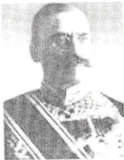
И. Я. Коростовец

Оросыг зорьсон юм. Орос-Монголын найрамдлын гэрээг байгуулхаар Оросоос хүрэлцэн ирсэн И.Я.Коростовцийн мэдээлснээр: "... Монголын эрх баригчид хяналт тавих асуудлыг огт зөвшөөрөхгүй... тэд бага хэмжээний зээл өгсөн ч болно гэж байна. Тиймээс бид "Монголор"-ын орлого, эсвэл гаалийн орлогыг нь барьцаалан зээл олгож, чингэхдээ эдгээрт тавих хяналтыг Консулын газарт эсвэл шинээр буй болгох албан тушаалтны тусламжтайгаар далдалсан хяналт тавьж болох юм" 77 гэсэн баримтыг түүхч Ж.Урангуа "XX зууны эхэн үеийн Монгол Улс" бүтээлдээ дурьдсан байна. 78