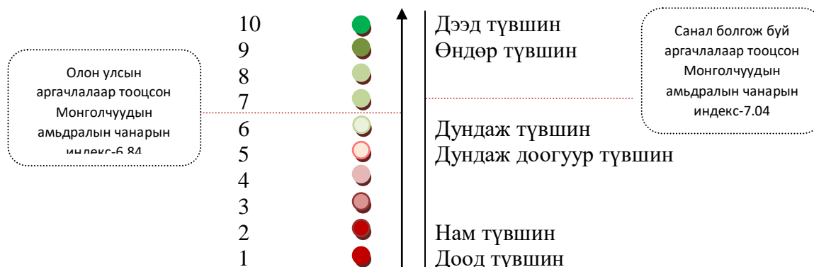
Зураг 2. Амьдралын чанарын индекс[10 хүртэлх оноогоор тооцсон үнэлгээ]

Монголчуудын амьдралын чанарын индексийг тухайн шалгуур үзүүлэлтээс гадна олон улсын түгээмэл аргачлал болох 9 үндсэн шалгуур бүхий олон улсын аргачлалд тулгуурлан тооцож үзэхэд 3.42 дундаж үнэлгээтэй байна. Үүнийг 10 хүртлэх баллаар тооцвол 6.84 буюу шинээр боловсруулсан шалгуураас 0.20 пунктээр бага байна. Олон улсын аргачлалд материаллаг нөхцөл, амьдралын өртөг болон эдийн засгийн үзүүлэлтийг гол болгосон, нөгөө талаар сэтгэл ханамжийг тооцоогүй байдал энэхүү үнэлгээний үр дүн зөрүүтэй гарахад нөлөөлсөн байхыг үгүйсгэхгүй. Нөгөөтэйгүүр Монгол хүний өнөөг биш маргаашийг хардаг уужуу тайван, хүлээцтэй байдал, итгэл үнэмшил, сэтгэл ханамжийн хүчин зүйлс үүнд нөлөөлсөн байж мэднэ. Олон улсын аргачлалд тулгуурлан тооцсон үр дүнгээр Монголчуудын амьдралын чанарыг дэлхийн улс орнуудтай харьцуулан үзэхэд 105-р байранд, шилжилтийн улс орнуудтай харьцуулахад 11-рт тус тус эрэмбэлэгдэж байна. Тухайн хэмжилтэд тулгуурлан Монгол Улсын хүн амын бүлгүүдийн амьдралын чанарт тулгамдаж буй зарим асуудлыг тайлбарласан болно.