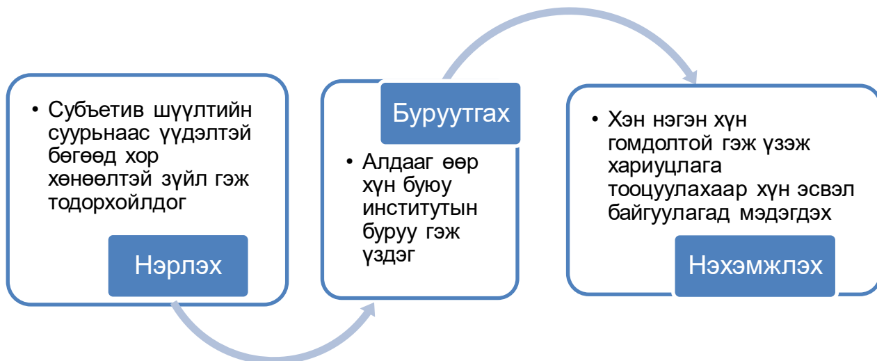
Зураг 1: Буруутгах үйл явц

Буруутгах хандлагын эцсийн үр дүн нь түүний илэрхийлэл байх бөгөөд нийгэм, улс төрийн амьдралд тусахдаа хүний зан байдал, эсэргүүцэл, улс төрийн оролцоо, улс төрийн хүчирхийлэл, хэвлэл мэдээллийн шүүмж, элит болон улс төрчдийг шүүмжлэх, төрд итгэх итгэл буурах зэрэг байдлаар илэрч байдаг.