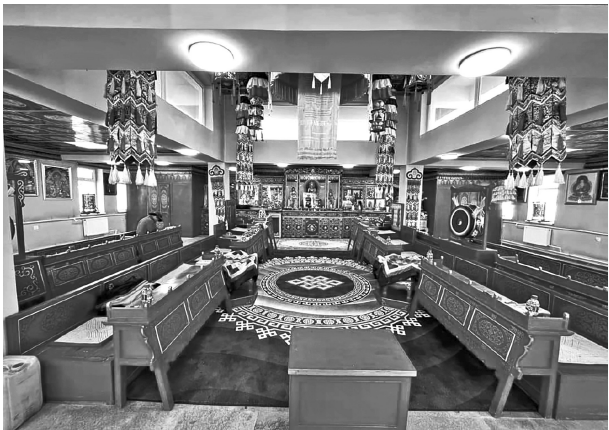
Ховд аймаг, Эрдэнэбүрэн сум Гандантунцаглон хийд (2021.10.20. гадна, дотно тал.)