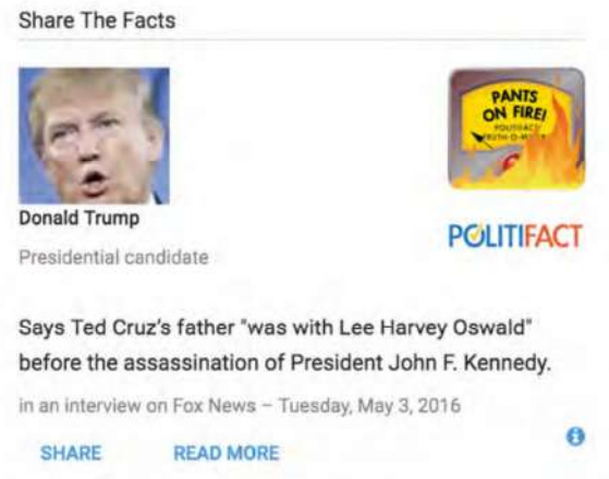
Зураг 3. Дональд Трампын энэхүү мэдээгдэл огт худал гэсэн түвшинд ангилагдсаныг цааш түгээх боломжийг харж болно

Үнэн зөвийн шүүлт хийгдсэний дараа PolitiFact олон нийтэд анализ бүхий нийтлэл хүргэдэг. Түүнчлэн нягталсан баримтуудыг Facebook, Twitter-т түгээх шууд холбоосор хангаж өгдөг.