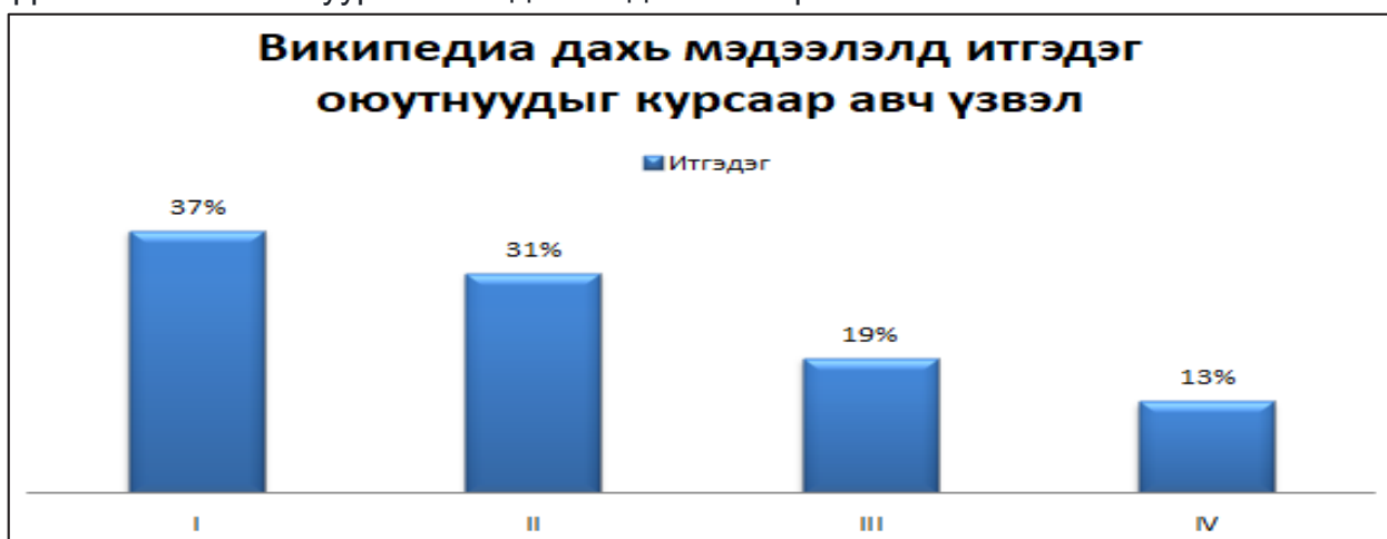
График №3. Википедиа хуудаснаас мэдээллээ баталагжуулдаг эсэх

итгэсэн эсэх, дараагийн алхам нь уг мэдээлэлд эргэлзсэн хэсэг нь Википедиагаар шалгах, гурав дахь шат нь мэдээллийн шар сайтаар нягтлах, дөрөв дэх алхам нь мэдээллийн найдвартай эх сурвалжаар баталгаажуулах гэсэн асуулгатай байв. Хавсралт А-д өгөгдсөн ил асуултаар мэдээлэл авахдаа эх сурвалжийг нь хардаг, худал мэдээллийг ялгадаг, түгээддэггүй гэж хариулсан ч шалгах асуултад буюу Фэйсбүүкт найзынхаа бичсэн постонд буюу худал мэдээлэлд итгэдэг гэж хариулт өгсөн оюутан /63%/, үүнийг хүйсээр авч үзвэл эмэгтэй 51 хувь, эрэгтэй 49 хувь байна. Ийнхүү манай улсад зөвхөн өсвөр үе, хүүхэд гэлтгүй насанд хүрсэн хүмүүст ч мэдээллийн боловсрол дутмаг байгаа нь хуурамч мэдээнд итгэж буй хүмүүсийн тоогоор батлагдаж байгаа юм. Харин дээрх мэдээлэлд эргэлзсэн хэсэг оюутнууд Википедиагаар шалгана гэж хариулсан /23%/ хэсгийг курсээр нь авч үзвэл нэгдүгээр курсын оюутнууд хамгийн өндөр буюу 37 хувьтай байна. Курс ахих тусам энэ тоо буурч байна. Үүнээс улбаалан оюутнууд их, дээд сургуульд суралцан курс ахих тусмаа академик түвшиний боловсрол эзэмшихийн хэрээр мэдээ, мэдээлэлд хандах хандлагад зөв ахиц гарч буйг харах боломжтой.