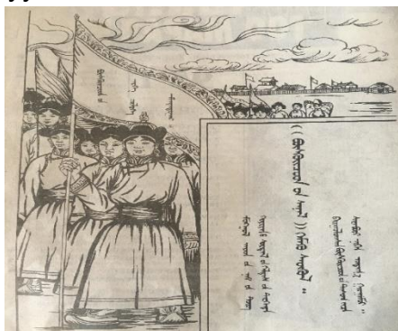
Зураг 1. “Бүсгүйчүүдийн санал” сэтгүүл. 1925 он.

сэтгүүлийн хавтас ч нэмэлт мэдээлэл дамжуулж байдаг.