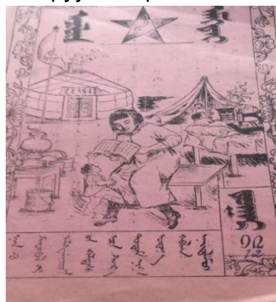
Зураг 5. “Ажилч эмэгтэй” сэтгүүл.1930 он.

сэн байна. Таван хошуу нь тухайн нийгэмд хувьсгалын ялалт, эрч хүч, эрэмгий зоригын илэрхийлэл болгон хэрэглэж байсан учир эмэгтэйчүүдийг уриалан дуудаж сэтгүүлдээ ийнхүү хэрэглэж байжээ. “Ажилчин эмэгтэй” сэтгүүл “Ажилч эмэгтэй” нэрээр нэг дугаар гарсан байдаг. Энэ нь ажилчин гэдэг нь мэргэшил, ажилч гэдэг нь гэр орон, амьдрал ахуйдаа ажилч байх чанарыг харуулж нэрлэсэн ажээ.