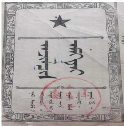
Зураг 4. “Ажилчин эмэгтэй” сэтгүүл .1930 он.

ноос орон нутагт эмэгтэйчүүдийн “улаан гэр” байгуулах тогтоол 7 гаргаж, улаан гэрийн эрхлэгчийг курс сургуулиар бэлтгэж байжээ. Ийнхүү сэтгүүл нь хавтсаа тухайн нийгэм, цаг үеийн асуудалд хувьсгалч байр сууринаас хандан өөрчилж байсан байна. “Эмэгтэйчүүдийн эрх” сэтгүүлийн дараа 1929 оны сүүл үеэс 1932 оныг хүртэл “Ажилчин эмэгтэй” нэрээр 13 дугаар 13*17 см, 14*25 см хэмжээтэй 3000-7000 ширхэгээр хэвлэгджээ. Монгол оронд жижиг техник бүхий гар ажиллагаатай аж үйлдвэрийн байгууллага, цөөн боловч үндэсний гар урчууд, улирлын ба байнгын хөлсний ажилчид зэрэг Монголын ажилчид, үндэсний ажилчин анги үүсэх болсон энэ үеэс сэтгүүл нэрээ өөрчлөн “Ажилчин эмэгтэй” нэртэй болжээ. 1930-аад он бол Монголд ажилчин, малчин, сэхээтний анги давхарга бий болж тэдний эгнээнд эмэгтэйчүүдийг олноор оруулах, сурталчлах явдал чухал байсан учир сэтгүүлийг ийнхүү нэрлэжээ.