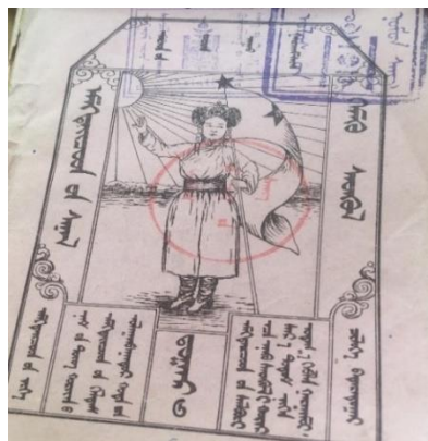
Зураг 2. “Эмэгтэйчүүдийн санал” сэтгүүл. 1927 он.

асуудал байсан учир ийнхүү уриалан дуудсан дайчин шинжтэй 4 гэж тодорхойлсон байна. “Бүсгүйчүүдийн санал” сэтгүүл гурван дугаар хэвлэгдсний дараа “Эмэгтэйчүүдийн санал” нэрээр 1925 оны сүүлээс 1929 оныг хүртэл 12 дугаар хэвлэгджээ.