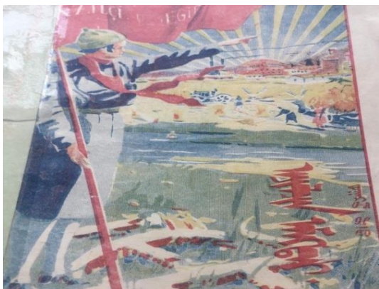
Зураг 6. “Ажилчин эмэгтэй” сэтгүүл. 1932 он.

Эмэгтэйчүүдийн сэтгүүл эхэн үедээ эмэгтэйчүүдийг эрх чөлөөгөө олоход нь туслах байсан бол 1930-аад оноос соёлжуулах, боловсруулах ажил эрчимжиж, европын соёл нэвтэрч хувин сав, гар ажиллагаатай техникүүд нэвтэрч ахуйд өөрчлөлт орж ирсэн тул сэтгүүл мөн нийгмийн өөрчлөлтөд зориулан хавтсаа өөрчилсөн байна. 13*17 хэмжээтэй байсан бол 14*25 хэмжээтэй болсон, хуудасны тоо нэмэгдсэн, зурмал зураг хэвлэгдэх болсон зэрэг давуу талууд ажиглагдаж байна. “Ажилчин эмэгтэй” сэтгүүл нь 1930-аад оны дугааруудаас эхлэн зурмал зураг нийтлэх болсон нь бичиг үсэггүй эмэгтэйчүүд, хүүхэд зургийг харж мэдээлэл авах боломжийг бүрдүүлсэн нь сэтгүүлийн давуу тал юм.