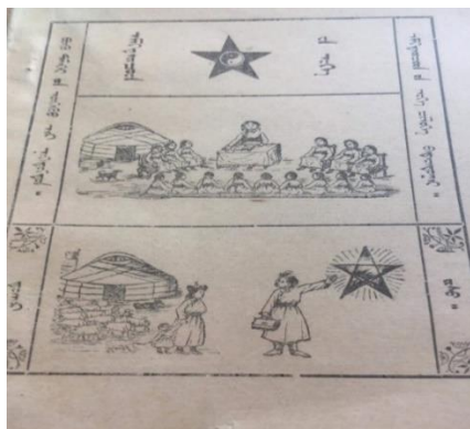
Зураг 3. “Эмэгтэйчүүдийн эрх” сэтгүүл. 1930 он.

сэтгүүлийн хавтсанд илэрхийлжээ. “Бүсгүйчүүдийн санал” нэрийг яагаад “Эмэгтэйчүүдийн санал” гэж нэрлэх болсон талаар ямар нэг баримт үлдээгүй байна. Гэвч бүсгүй гэдэг үг нь хуучин феодалын нийгмийн үг хэллэг, харин эмэгтэйчүүд гэдэг нь орчин үеийн шинэ нэр томъёог ашигласан байж болох юм. “Эмэгтэйчүүдийн санал” сэтгүүдийн хавтас нь Монгол оронд мандсан шинэ нийгэм, журам, хувьсгалд эмэгтэйчүүдээ уриалан дуудсан, зарлан тунхагласан шинжтэй ажээ. “Эмэгтэйчүүдийн санал” сэтгүүлийн дараа 1929 оны сүүлээр нэг, 1930 оны эхээр нэг дугаарыг “Эмэгтэйчүүдийн эрх” хэмээн нэрлэж хэмжээг багасган 12*14 хэмжээтэй хэвлэжээ. Сэтгүүлийн нэрийг “Эмэгтэйчүүдийн эрх” хэмээн өөрчлөх болсон шалтгаан нь Монгол улс 1924 оны 11-р сарын 26-ний өдөр батласан БНМАУ-ын. Анхдугаар Үндсэн хуулинд “Тус улсын харьяат ард түмэнд угсаа, шашин, эрэгтэй, эмэгтэй гэдэг ялгаваргүй нэгэн адил эрхийг эдлүүл” 5 гэж зааснаар хуулиар хамгаалагдсан эрх чөлөөгөө илэрхийлэх, мөн 1925 онд эмэгтэйчүүдийг богтлох явдлыг хориглосон засгийн газрын тогтоол гарсан нь эмэгтэйчүүдийг эрх чөлөөтэй болсныг зарласан шийдвэр зэрэг нь сэтгүүлийн нэр өөрчлөгдөх шалтгаан болсон байх үндэстэй юм.