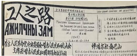
Зураг 2. “Ажилчны зам” сонин.

Сонины хэмжээ 2/1 бөгөөд нэг удаагийн сонин бүр Хятадын 16000 үсгийн тэмдэгт хэрэглэдэг. Тус сонинг захиалах жилийн төлбөр нь 25 төгрөг байсан нь тухайн үед нэлээд үнэтэй хэвлэлийн тоонд орж байжээ.