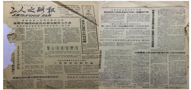
Зураг 3. “Ажилчны зам” сонины дугаарууд

“Ажилчны зам” сонины нэг жилийн дугаарыг ажиглахад, сонин хэд хэдэн булантай улс төр, эдийн засаг, дотоодын болон дэлхийн мэдээ, соёл гэгээрэл, утга зохиолын бүтээлүүд, цаг уурын мэдээ, зар мэдээг хэвлэн нийтэлдэг байсан бөгөөд үүнээс хамгийн өндөр хувьтай нь дэлхий дахины мэдээ мэдээлэл байна.