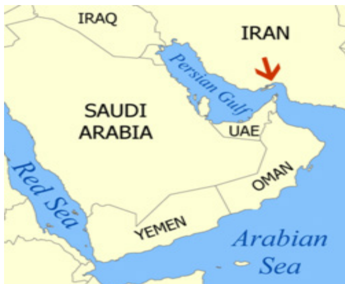
Зураг 1. Ормузын хоолой

Тоо баримт дурдвал, дэлхийн газрын тосны экспортын 40-46 хувь нь энэ хоолойгоор дамждаг бөгөөд цаашид тээврийн хэмжээ өсөх төлөвтэй байна. Энэ замаар тээвэрлэх газрын тосны хэмжээг жилд дунджаар 2 хувиар тогтмол өснө гэж тооцоод, 2030 он гэхэд дэлхийн газрын тосны нийлүүлэлтийн 2/3 нь Персийн булангаар дамжина хэмээн Олон улсын эрчим хүчний агентлаг таамаглаж байна. Ормузын хоолойгоор 1 өдөрт 17 сая баррель газрын тос тээвэрлэдэг нь далайгаар дамжин хийгддэг дэлхийн худалдааны 30 хувийг болно. Мөн Ормузын хоолойгоор жилд дунджаар 33 тэрбум куб метр байгалийн хий тээвэрлэдэг нь жилд дунджаар