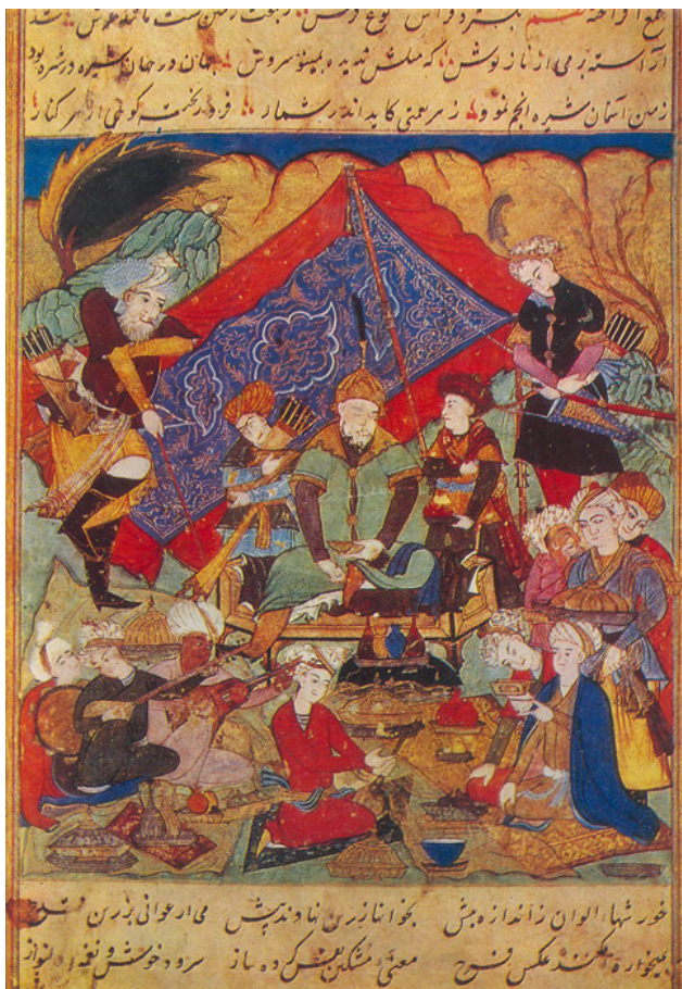
Зураг №2. Төмөр хаан Самарканд хотод найрлаж буй нь. 1370-1405 онд хаанчилж байсан.

Эх сурвалж: https://ru.wikipedia.org/wiki