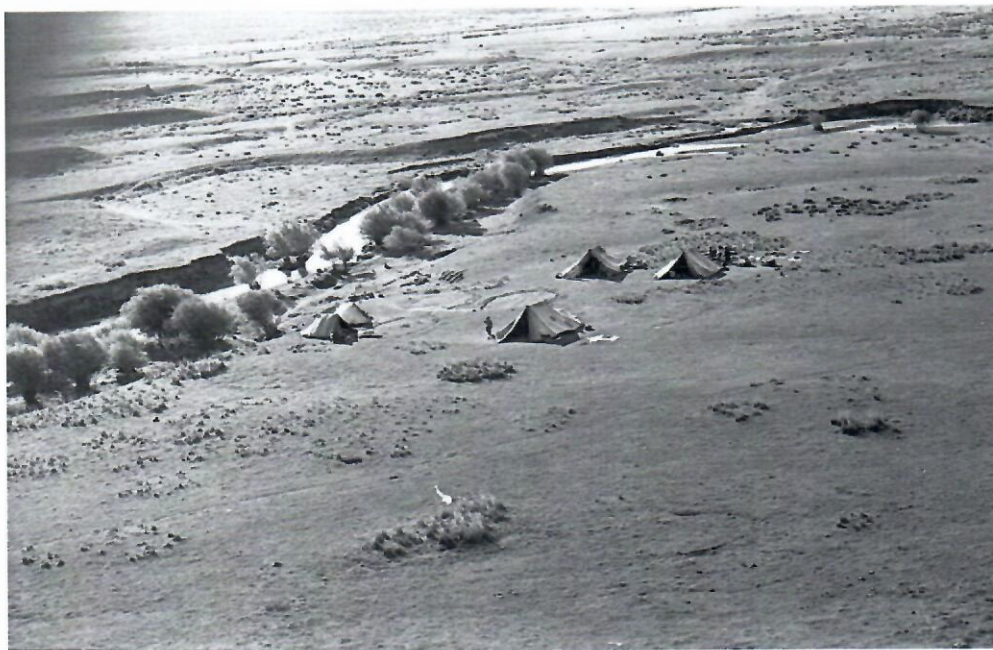
Зураг 2. 1968 оны Өрмөгтэйн геологийн зураглалын дадлагын полигон