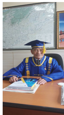
МУИС-д багш болов, 1975-6-16, тушаал №400

Аливаа юманд анхдагч байх амаргүй, миний унаган мэргэжил уулын инженер-өрөмдөгч, удаах мэргэжил газрын тос, хийн улмаар багш гэсэн нийтлэг нандин, эрхэм хүндтэй мэргэжлийг эзэмших, эзэн нь байхын тулд хоёргүй сэтгэлээр