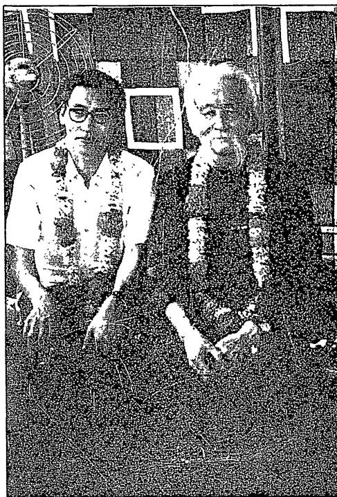
Энэтхэгийн ерөнхий сайдын хүлээн авалтын үеэр

Тийнхүү Жагарын тэнгэр дор их багштаныхаа үзэж харсан, дуулж сонссон сонин сайханаас нь яриулж, далай их эрдэмийг нь биширч өнгөрөөсөн бүтэн долоо хоног нүд ирмэхийн зуур харван өнгөрч билээ.