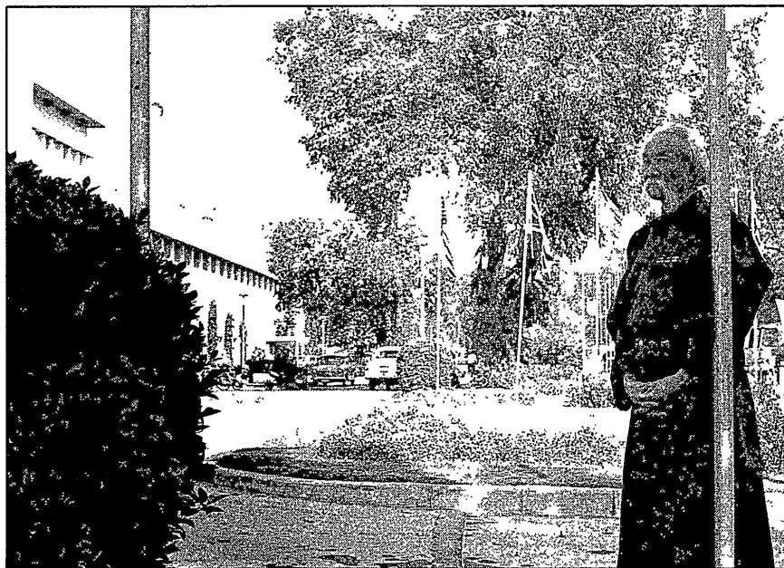
Энэтхэгийн "Эрдэмийн Ордон"-ы үүдэнд төрийнхөө далбааны өлмийд багштаныгаа зурагийг авсан минь. Шинэ Дели. 1972.03.29.