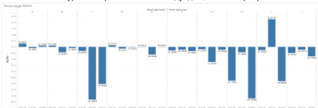
Зураг 1. Хөрөнгийн өгөөжийн дундаж, А-Ж салбараар

Үнэлгээгээ хийхдээ бид тогтмол нөлөөний загвар (fixed effect model)-аар ялгаврын ялгавар (difference-in-difference) аргыг ашигласан бөгөөд загварын тавил нь дараах байдалтай байна.