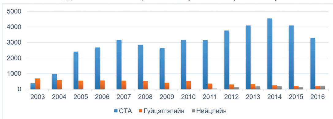
Дүрслэл 2. ҮАГ-аас гүйцэтгэсэн аудитын тоо (2003-2016)

Эх сурвалж: ҮАГ-ын 2016 оны үйл ажиллагааны тайлан