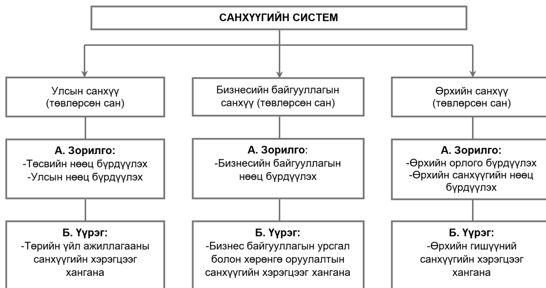
Зураг 2. Санхүүгийн системийн бүрэлдэхүүн

Санхүүгийн системийг бүрдүүлэгч бүрэлдэхүүн хэсэг нь нийгмийн бүтээгдэхүүн ба ажиллах хүчний нөхөн үйлдвэрлэлд нягт холбоотойгоор бие даасан байдлаа хадгалан хөгжиж, бэхжиж