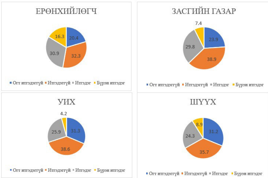
Зураг-1. Төрийн институцэд итгэх итгэл

Судалгааны үр дүнгээс үзэхэд төрийн дөрвөн институцэд итгэх итгэл ихээхэн суларсан байгааг бид харж болно. Тухайлбал, Засгийн газарт иргэдийн-38.9%, УИХ-д иргэдийн 38.6%, нь итгэдэггүй бол УИХ-д иргэдийн 31.3%, Шүүх засаглалд иргэдийн 35.7% нь огт итгэдэггүй гэж хариулсан байна.