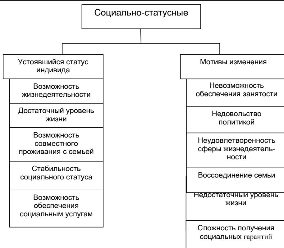
Рис 4. Классификация реальных факторов миграции

Поскольку социально-статусные факторы формируют наиболее значимые условия миграционных намерений, следует остановиться наиболее подробнее. Как отмечалось, социальный статус индивида представляет интегрированный критерий жизнедеятельности в конкретный период времени на конкретной территории. Поэтому данный вид факторов имеет важное значение с целью управления миграцией в целом. Главное, выявить мотивы, которые лежат в основе изменения статуса индивида. В отдельных случаях мотивы изменения статуса могут быть обусловлены условиями жизни и быта индивида, уровнем и образом жизни либо нравственной обстановкой в которой осуществляется жизнедеятельность.