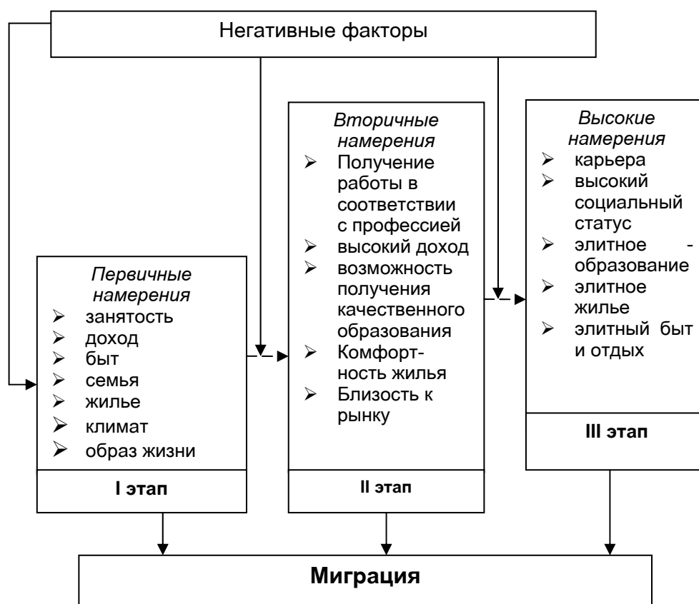
Рис 3. Этапы формирования миграционных намерений

Непосредственно индивид считает, что решение проблем занятости, обустройства жильем, улучшения жизни может быть