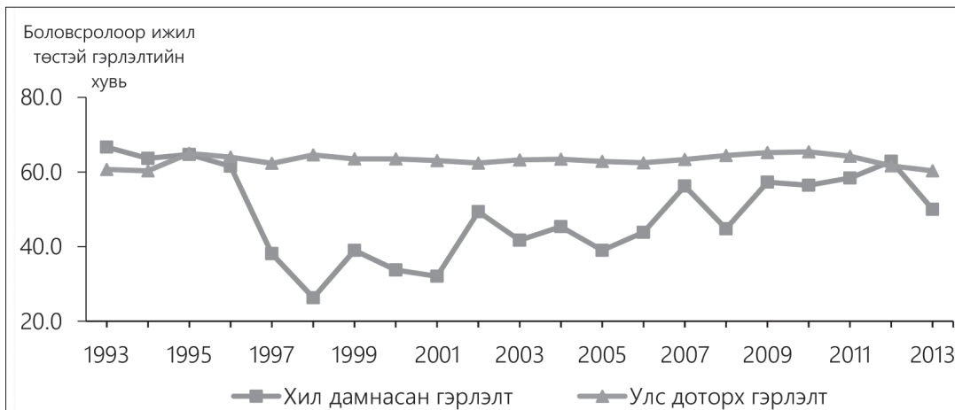
Зураг 5. Нийт гэрлэлтэд боловсролоор ижил төстэй гэрлэлтийн эзлэх хувь, хил дамнасан гэрлэлтийн байдал ба гэрлэсэн оноор (1993-2013)

Эх үүсвэр: МУ-ын УБЕГ-ын 1993-2013 оны гэрлэлтийн бүртгэлийн мэдээлэлд үндэслэн тооцов.