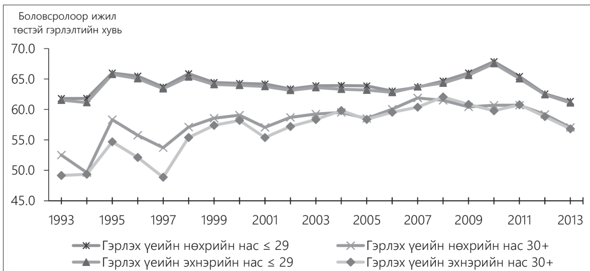
Зураг 3. Нийт гэрлэлтэд боловсролоор ижил төстэй гэрлэлтийн эзлэх хувь, гэрлэх үеийн хосуудын нас ба гэрлэсэн оноор (1993-2013)

Эх үүсвэр: МУ-ын УБЕГ-ын 1993-2013 оны гэрлэлтийн бүртгэлийн мэдээлэлд үндэслэн тооцов.