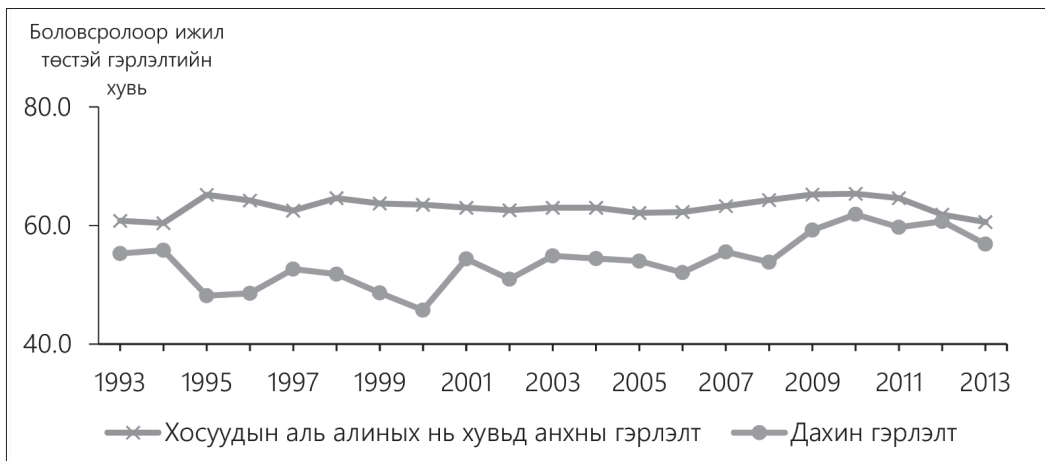
Зураг 4. Нийт гэрлэлтэд боловсролоор ижил төстэй гэрлэлтийн эзлэх хувь, гэрлэлтийн төрөл ба гэрлэсэн оноор (1993-2013)

Эх үүсвэр: МУ-ын УБЕГ-ын 1993-2013 оны гэрлэлтийн бүртгэлийн мэдээлэлд үндэслэн тооцов.