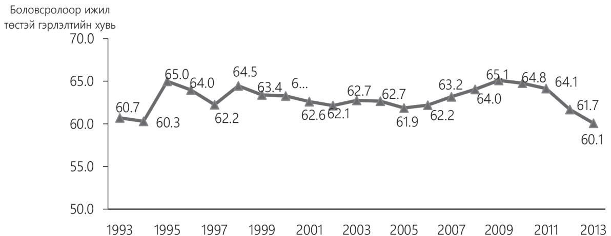
Зураг 1. Нийт гэрлэлтэд боловсролоор ижил төстэй гэрлэлтийн эзлэх хувь, 1993-2013

Эх үүсвэр: МУ-ын УБЕГ-ын 1993-2013 оны гэрлэлтийн бүртгэлийн мэдээлэлд үндэслэн тооцов.