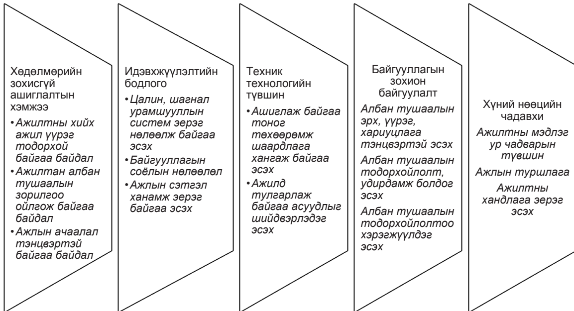
Зураг 3. Хөдөлмөрийн бүтээмжид нөлөөлөгч хүчин зүйлүүд

Хөдөлмөрийн бүтээмжинд нөлөөлөгч хүчин байгууллагын зохион байгуулалтаас хамаарч зүйлүүдийг хүний нөөцийн чадавхи болон дараах 5 түвшинд ангилан судлах боломжтой.