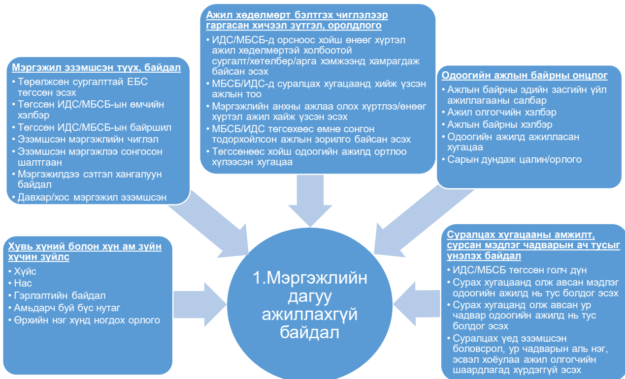
Зураг 1: Дүн шинжилгээний хүрээ

Дээрх үзэгдэлд нөлөөлж болох хүчин зүйлс буюу тайлбарлах хувьсагчдыг ерөнхийд нь 5 бүлэгт ангилан судалсан ба тэдгээрийн ерөнхий жагсаалтыг Зураг 1-д, дэлгэрэнгүй тайлбарыг Хавсралт 1-д тус тус харуулав.