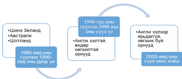
Зураг 1. Мэргэшлийн хүрээ: Үүсэл, хөгжил