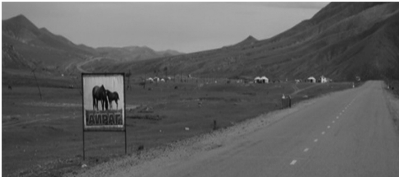
Фото 1. Төв аймгийн Борнуур сумын орчимд малчдын зусланд буусан байдал