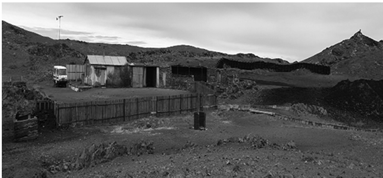
Фото 2. Өмнөговь аймгийн Цогтцэций сумын 2-р багийн малчин айлын өвөлжөө