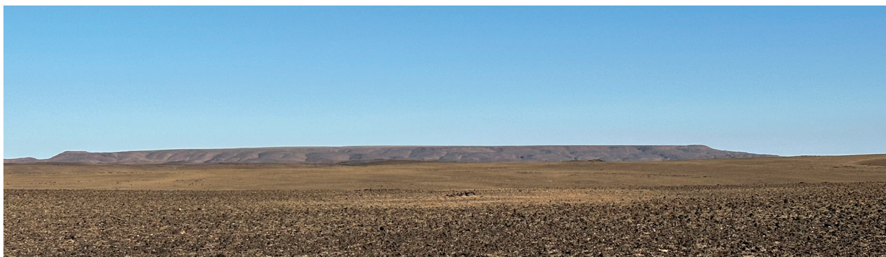
Зураг 1. Тэвш (Тэгшийн улаан) уул