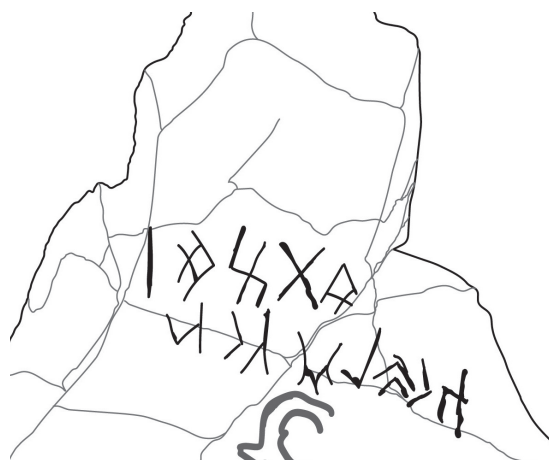
Зураг 5. Хүрмэн хадны бичээсийн гар зураг