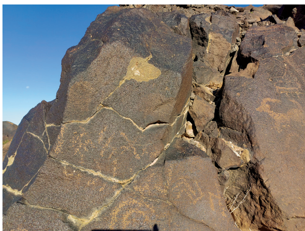
Зураг 4. Хүрмэн хадны бичээс