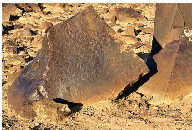
Зураг 2. Их Дуутын бичээс