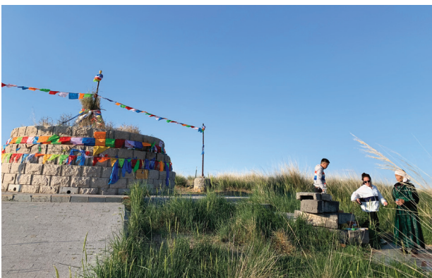
Зураг 1. Балбачийн рашааны овоо

Энэхүү рашаалах үйл явцад рашаан уух, рашаанд суух, рашааны шавар заслага, рашаан сувилал, холбогдох эм тан хүртэх зэрэг рашаантай холбоотой уламжлалт анагаах ухааны нэгэн цогц соёл болдог. Балбачийн рашааны гол үзэмжийн нэг болох рашаан засал бол сайхан байгалийн үзэмж дундах хүний нийгмийн үзэмжийн үйл ажиллагааны үр дүг болох юм. Соёл бол нэг зүйлийн тэмдгээр дамжин уламжлагдсан утга агуулгын хэв загвар юм. Монголчуудын уламжлалт ахуйн ойлголт нь бэлгэдлийн хэв загвартай