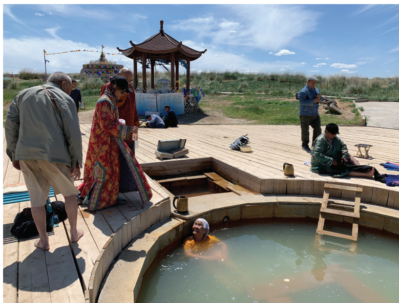
Зураг 3. Рашаанд сууж буй рашаанчид

Өөрсдийн амьдарч буй хүрээлэн буй орчны талаарх орон нутгийн иргэдийн мэдлэгийг нь харилцан адилгүй байдаг. Өөрөөр хэлбэл эдгээр мэдлэгийн эзэмшигчид нь байгаль цаг уурын онцгой байдалд өөр өөрсдийн туршлага, мэдрэмжээр ханддаг [(詹姆斯·斯科特 2019)]. Тогтох эмч бол Балбачийн рашаан дээр эм барьж байгаа монгол эмч болно. Рашаан засал хийхэд монгол эм хавсарган хэрэглэвэл өвчин засрах нь хурдан бөгөөд ач тус нь сайн байдаг. Балбачийн рашаантай уяалдсан түүний эм танга авч үзвэл: хий өвчинд агар -8, сорозонноров, шар өвчинд бунгар -13, сортог -5, батган өвчинд себоро -4, бадамдивжваа,