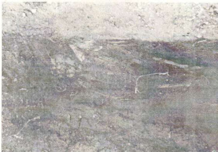
Дорнод, Хөлөнбуйр. Тахилгат уул. 11-р булш