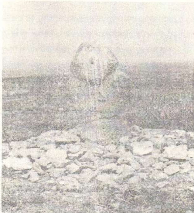
Дорнод. Хөлөнбуйр. Өлзийтийн хүн чулуун хөшөө