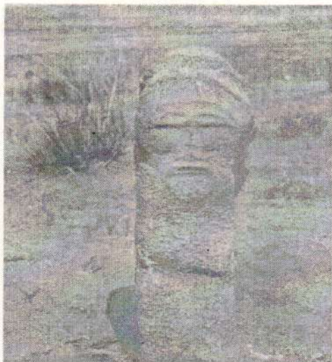
Хэнтий, Мөрөн сум. Хүн чулуун хөшөө