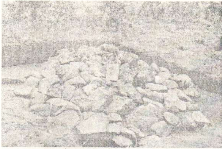
Дорнод. Хөлөнбуйр. Тахилгат уул. 6-р булш