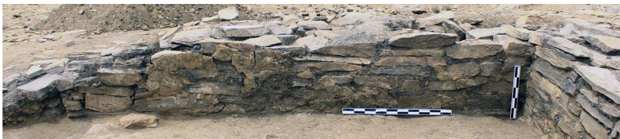
Зураг 5. “Довжсоо-1”. Барилгын баруун ханын үлдэгдэл