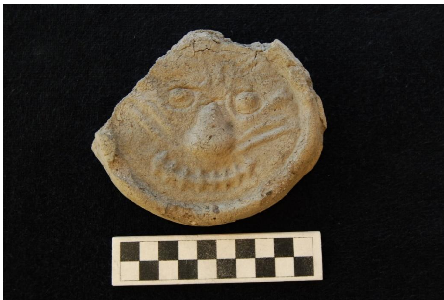
Зураг 7. Барилгын дээврийн төгсгөлийн эр ваарны тольт буюу нүүр ваар