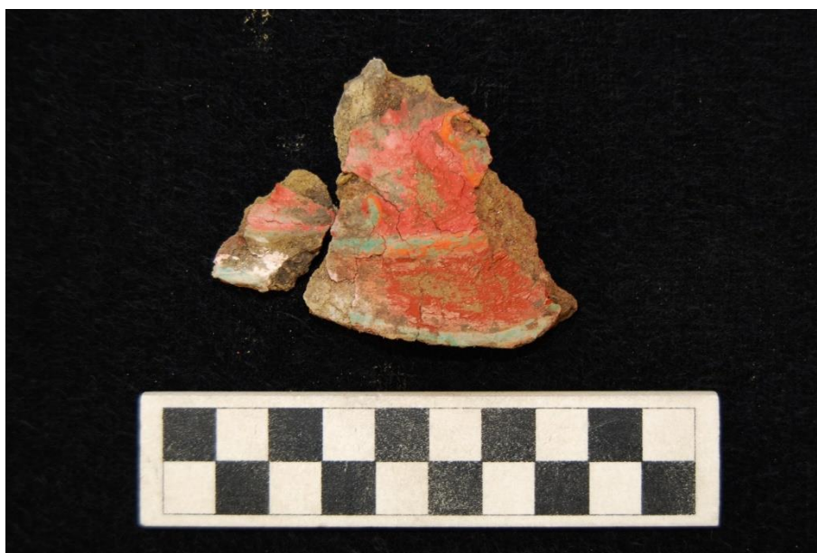
Зураг 11. Бадамлянхуа сэнтийн хэсэг – түүхий шавраар хийж будсан