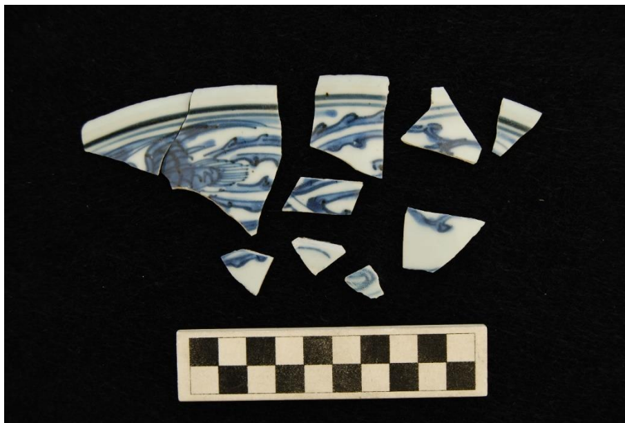
Зураг 13. Хөх хууртай шаазангийн хагархай