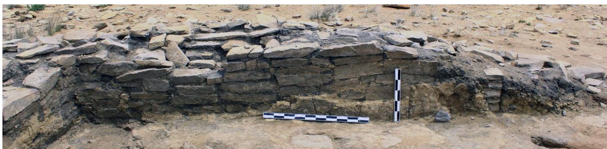
Зураг 6. “Довжсоо-1”. Барилгын зүүн ханын үлдэгдэл