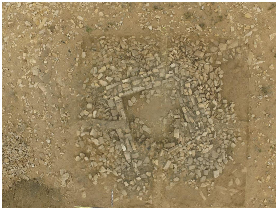
Зураг 3. “Довжоо-1”. 2018 онд малтан шинжилсэн барилгын үлдэгдэл