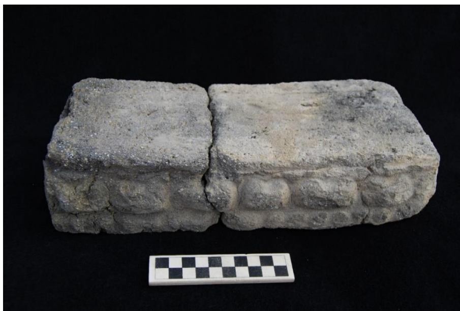
Зураг 10. Барилгын чимэглэлийн тоосго