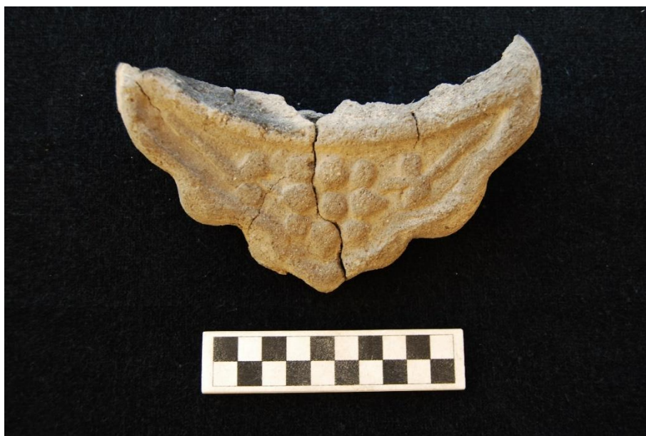
Зураг 8. Дээврийн төгсгөлийн эм ваарны тольт