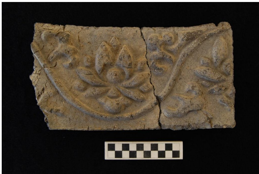
Зураг 9. Барилгын дээврийн дэлийг чимэглэж байсан хөх тоосгон хавтан