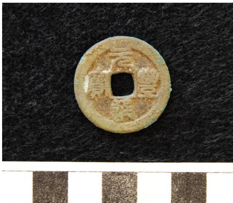
Зураг 14. “Юань-фен-тун-бао” хэмээх хятад зоос. Умард Сүн (960-1127) улсын Шэнзун хааны үе (1068-1085)