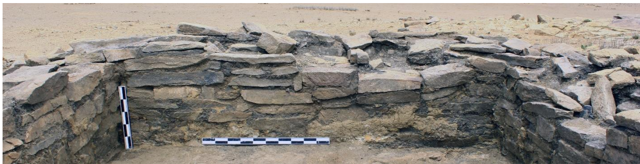
Зураг 4. “Довжсоо-1”. Барилгын хойд ханын үлдэгдэл