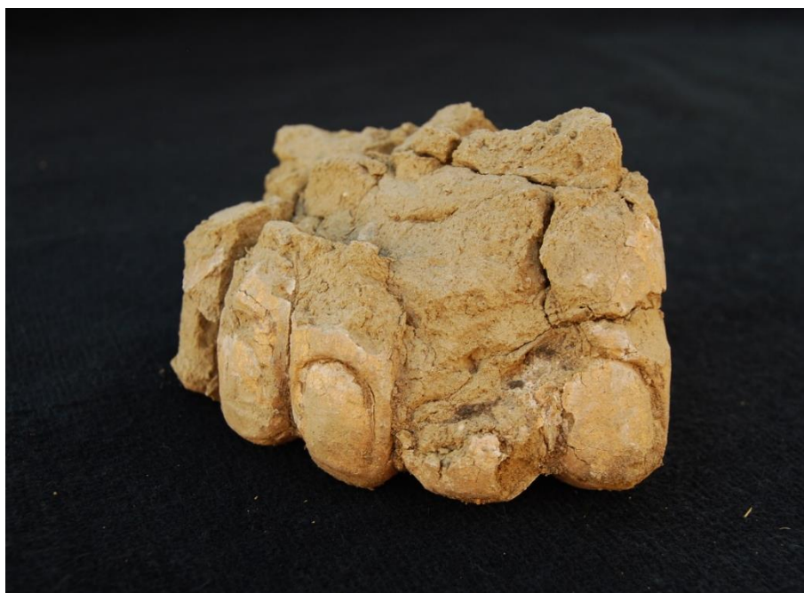
Зураг 12. Шавар бурханы хөлийн хэсэг