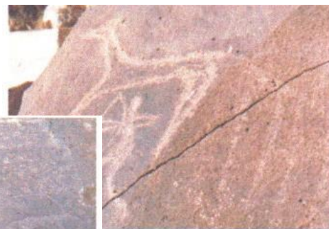
赤峰克旗小河洛沟村岩