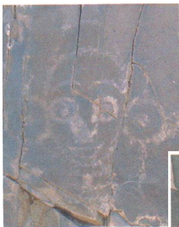
图 3 赤峰翁旗巴润高日苏岩画