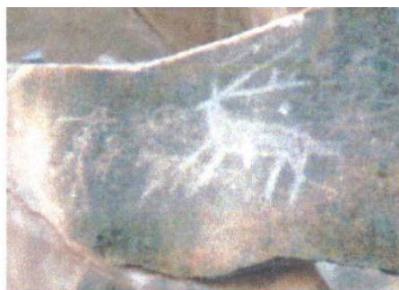
图 7 赤峰市克旗万合永乡岩画

的艺术风格主要有写实主义风格、象征主义风格，也有装饰与术风格等。其中以写实风格的岩马、骑者等形象栩栩如生、惟妙赤峰岩画多具写实主义风格，但张。岩画以石壁为画面，供人远张。同时，在当时的物质条件和下。很难刻画细部，所以略去细形，突出主要特征，这就形成岩画图像，则突出其胖体长鼻；如其鬃毛戟列；画猴子，则拉长其则夸张其大角；画牛，则强调其