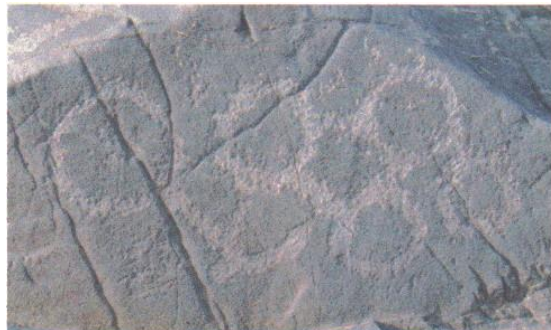
图8 赤峰市翁旗巴润高日苏岩画

形成和实践创造活动是艺术的基本特征。当技术达到一定程度，经过加工过程能够产生特定的形式时，这时才会有真正的艺术。只有发展了的技术才能产生完善的形式，所以技术和美感之间必然有着密切的联系，而且形成美感是随着技术活动的发展而不断发展的。概括地说，赤峰岩画所使用的技术主要有刻与绘两种，以刻的方法为主。