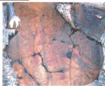
图11 赤峰克旗榆树广村岩画