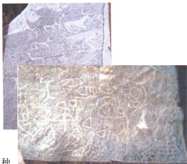
图 6 赤峰市初头朗镇福山庄岩画

的艺术风格主要有写实主义风格、象征主义风格，也有装饰与术风格等。其中以写实风格的岩马、骑者等形象栩栩如生、惟妙赤峰岩画多具写实主义风格，但张。岩画以石壁为画面，供人远张。同时，在当时的物质条件和下。很难刻画细部，所以略去细形，突出主要特征，这就形成岩画图像，则突出其胖体长鼻；如其鬃毛戟列；画猴子，则拉长其则夸张其大角；画牛，则强调其