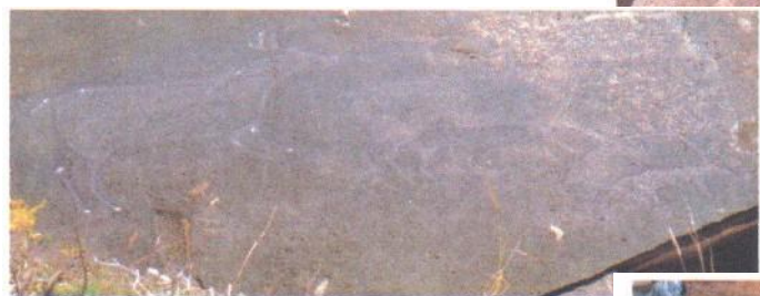
图十②赤峰市克旗万合永乡大河隆村岩

绘制岩画是用颜料涂绘于平滑岩面上。赤峰克旗榆树光村西北山崖底，离地面体米多，土红色会址。（图11）