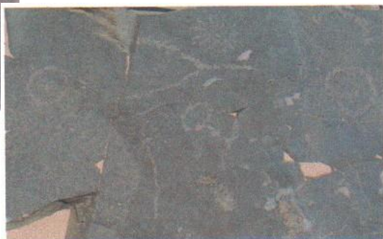
图 4 赤峰市翁旗巴润高日苏岩画

赤峰岩画多采用平面布置法，没有透视和空间立体关系，有的岩画构图具有整体和谐统一的形式美感。有少数狩猎和畜牧岩画的构图充分运用平面造型手段，表现宏大的场景（图 5）；有的岩画同时表现多种动物和人物，构图严整，如（图 6），各种形象排列整齐，地上、天上表现在同一平面上，具有强烈的艺术表现力。