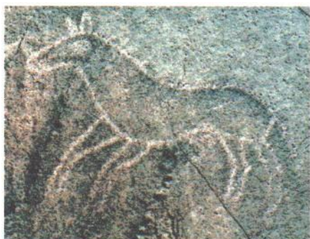
图 1 赤峰克旗岩画

赤峰岩画的分期和断代, 一直是岩画研究中一个难题。赤峰地区岩画的创作年代最久远的可以上溯到新石器时代。