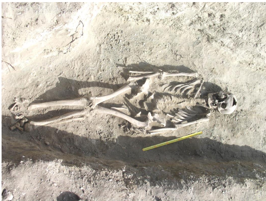
Шарга III. 6-р булш