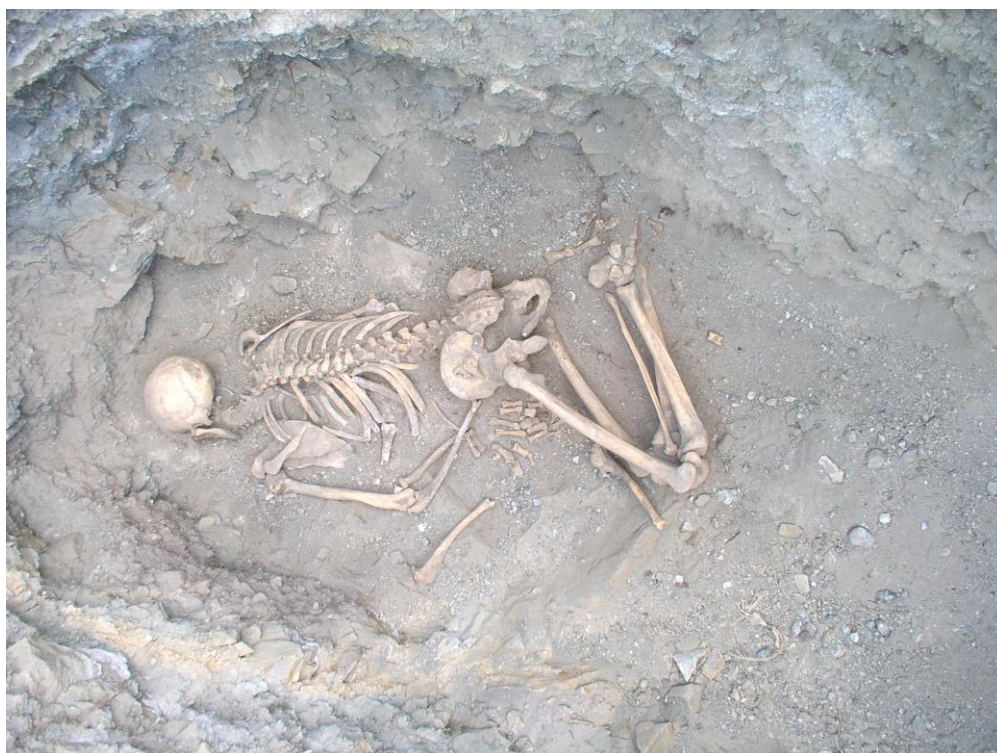
Шарга III. 5-р булш