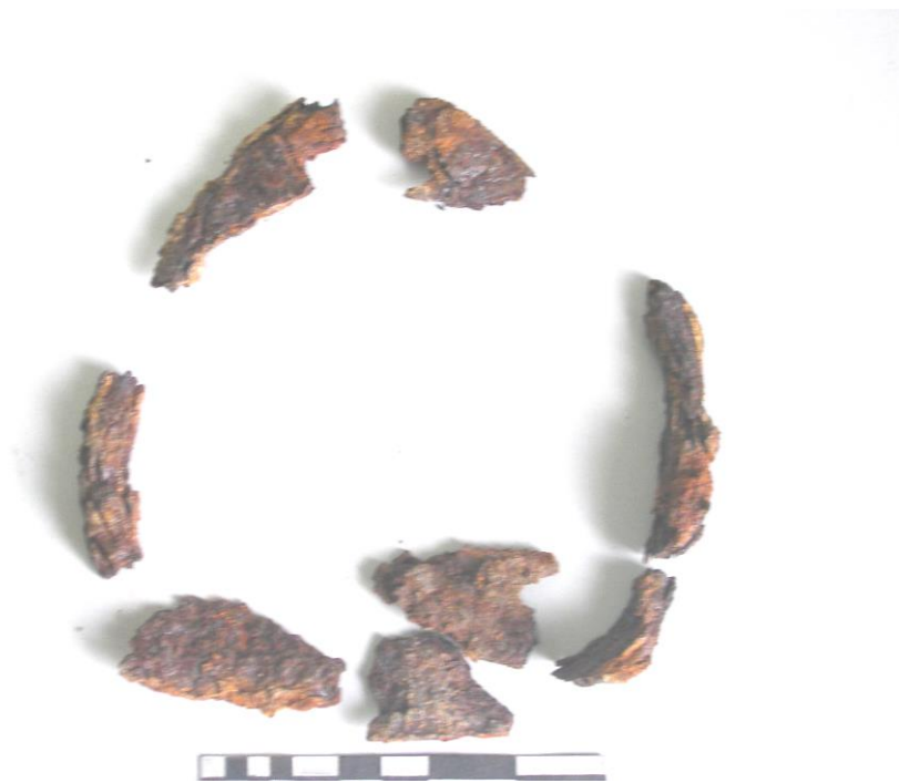
Шарга III. 1-р булшнаас гарсан төмөр дөрөө