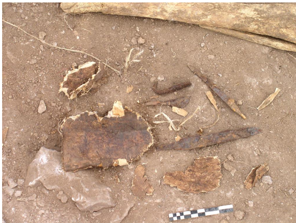
Ачаат 53-р булш. Төмөр хутга, хуурай, зэв, үйс