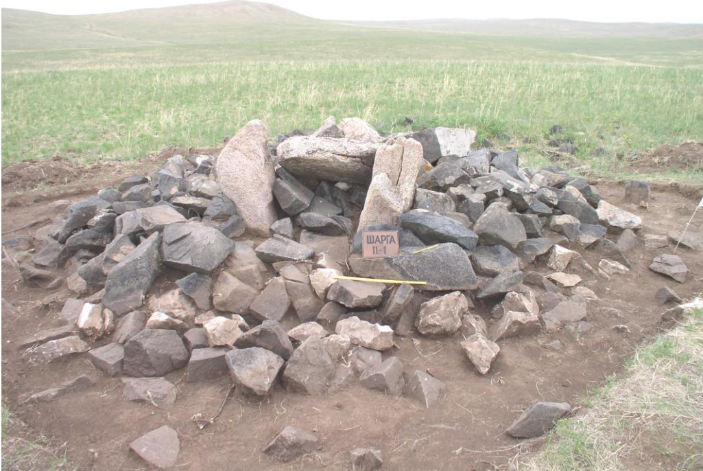
Шарга II. 1-р булш