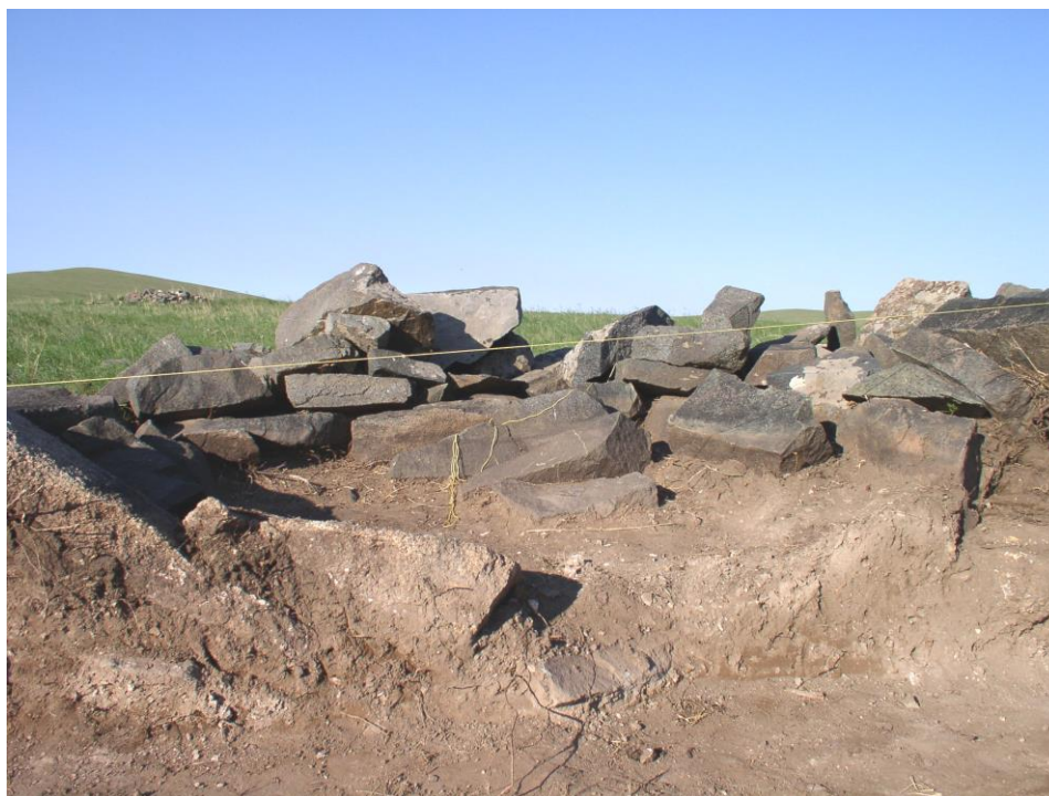
Шарга II. 4-р булшны хажуугийн зүсэлт