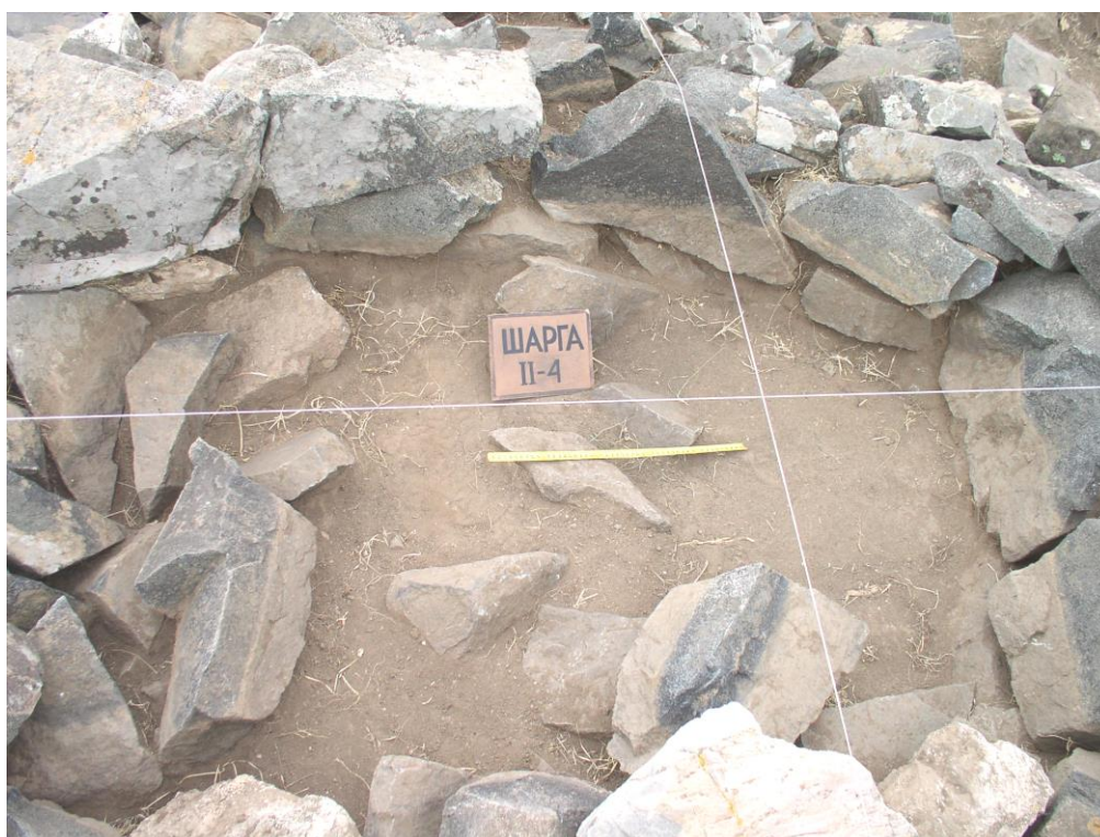
Шарга II. 4-р булшны цист