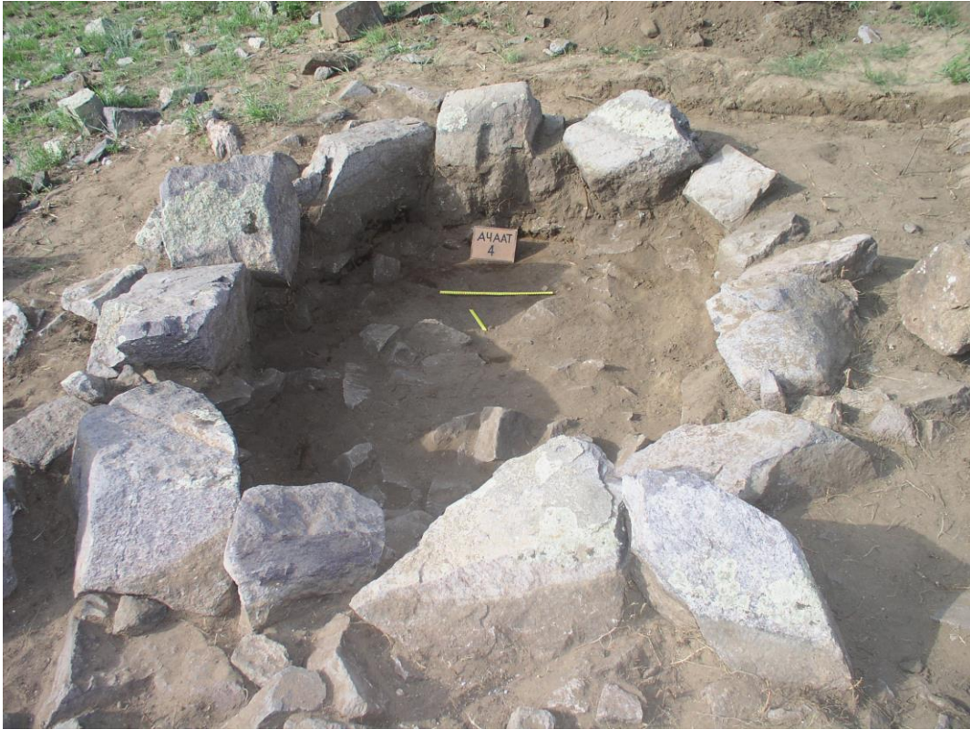
Ачаат 4-р булш. Цэвэрлэсний дараа