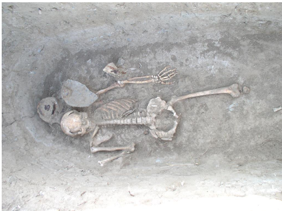
Шарга III. 1-р булш