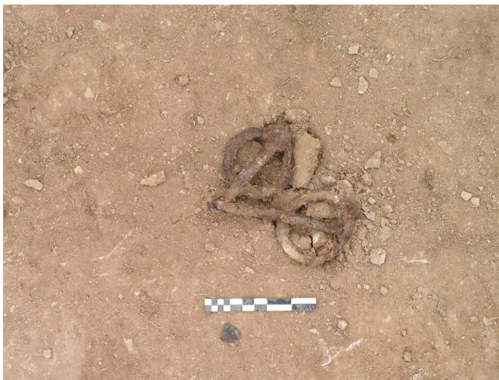
Ачаат 53-р булш. Амгай