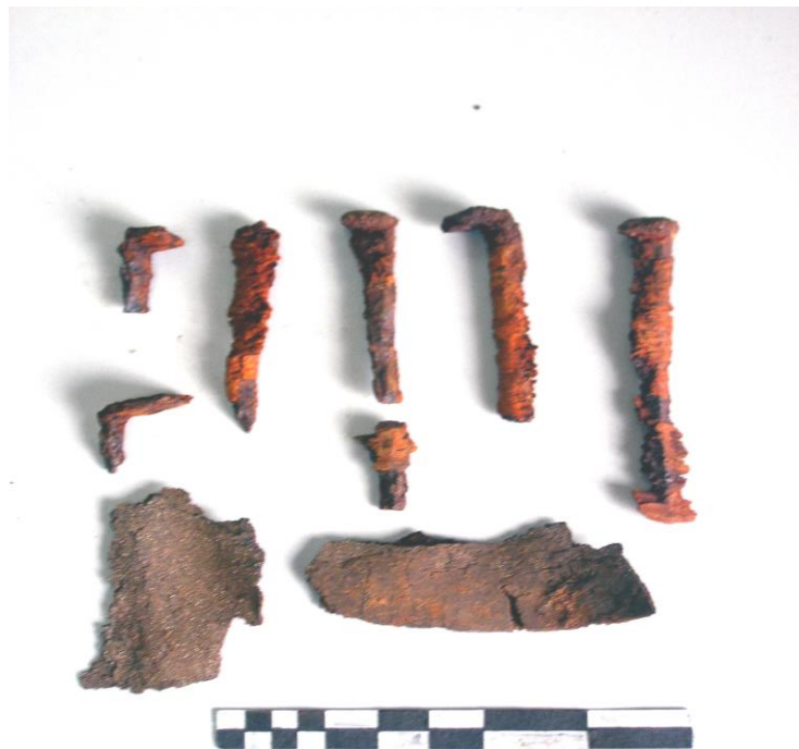
Ачаат 4-р булш. Үйс, авсны хадаас