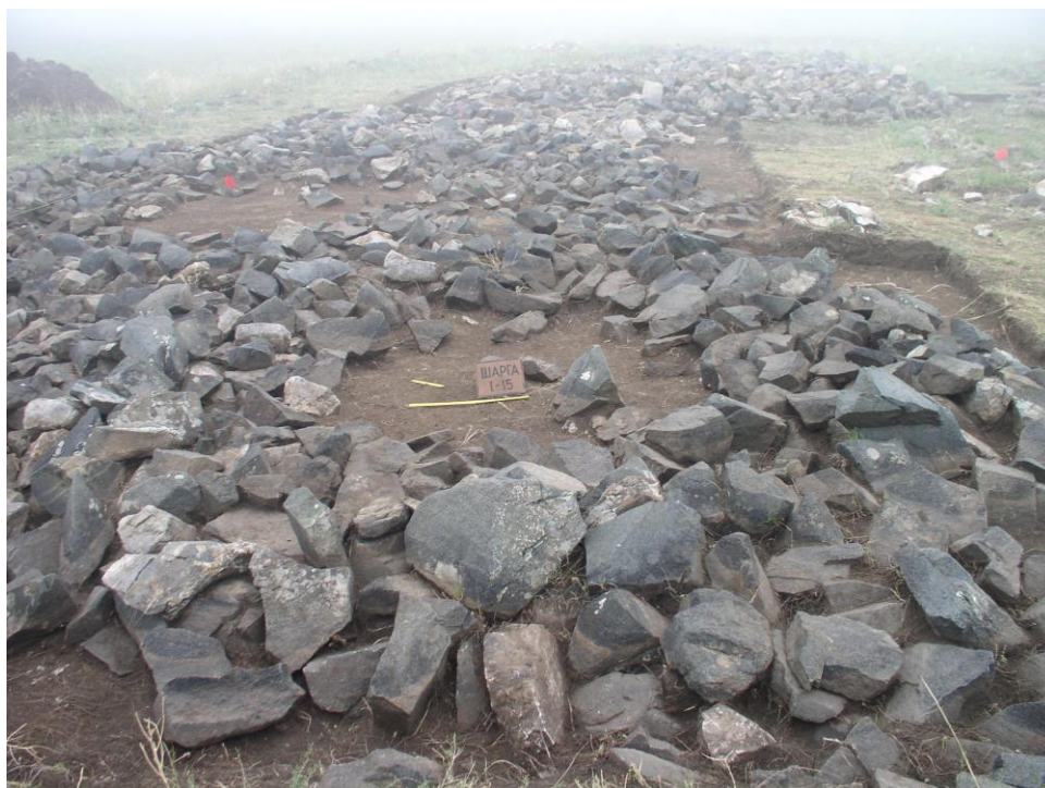
Шарга I-р булш (Хойд талаас)

Last few years, under the financial support of the ARC, NUM, several expeditions were organized in the territory of the Eastern Mongolia and have revealed a number of cemeteries from the early Mongolian period. In this paper we present the results of the archaeological excavations in Sharga and Achaat Mountains in the territory of Sukhbaatar province, Eastern Mongolia.