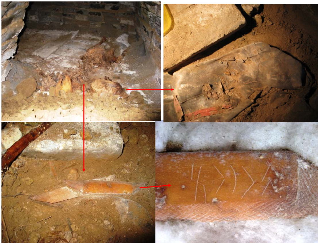
Зураг 1. Нумын ясан наалт олдсон байдал