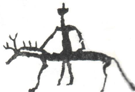
Зураг 7. Эвэртэй морьтон (Цэвээндорж нар. 2004: 43)

Эвэрт амьтанг тотемчлон үзэх үзлээс гадна эвэрт баатар, эвэртэн ван, эвэртэн дайчид гэх мэт цол хэргэм зэргийн эвэр шүтлэгийн хэлбэр байдаг. Тухайлбал: “Хоу хань шу”-гийн мэдээгээр Хүннүд арван эвэртэн ван байсан. Эхний дөрвөн ванг “Дөрвөн эвэртэн ван”, дараах зургааг “Зургаан эвэртэн ван” гэнэ (Сүхбаатар, 2000: 59). Мөн Солонгост эвэртэй малгай өмссөн “Эвэрт ван” байжээ (Сумьяабаатар, 1975: 71-75). Японы самуурай нар дуулгандаа буга, үхрийн эвэр зүүдэг нь тухайн гэр бүлийн шүтлэгт амьтан байхаас гадна зөвхөн самуурай буюу вангийн хэргэм зэрэгтэй дүйцэхүйц эрх мэдэлтэй хүмүүс л эвэртэй малгай өмсдөг байсан бололтой.