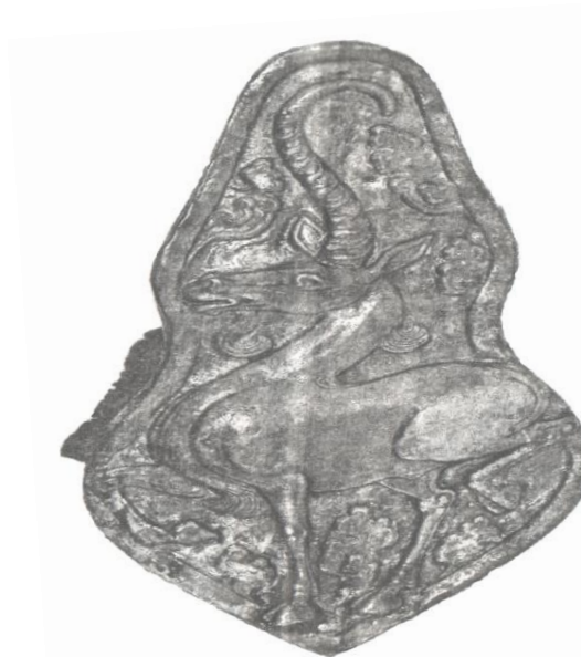
Зураг 5. Хүннүгийн үеийн булшнаас гарсан ганц эвэртэнг дүрсэлсэн чимэглэл (Ёрөөл-Эрдэнэ, 2007).

Булган аймгийн Хутаг-Өндөр сумын нутаг Бурхан толгойн 11-р булшнаас 30 см урт бугын эвэр мөн нэг богино салаа гарчээ. Бурхан толгойн 15-р булш нь модон хашлагатай эрэгтэй хүнийг оршуулсан ба эндээс буга, гөрөөсний эврээр хийсэн ямар нэгэн зүйлийн бариул бололтой зүйл мөн тахилын хайрцагнаас бугын эврийн хэсэг илэрсэн (Төрбат, Амартүвшин, Эрдэнэбат, 2003: 59,60). Бурхан толгойн 17-р булшны нүхний зүүн хойд булангаас бугын эвэр гарсан ба булшинд хорин таваас дээш насны эрэгтэй хүнийг оршуулжээ (Төрбат, Амартүвшин, Эрдэнэбат, 2003: 50). Бурхан толгойн 18-р булшны дараасыг хуулах явцад чулуун өрлөгийн баруун урдаас бугын эврийн хэсэг гарсан, булшинд гучаас дээш насны эрэгтэй хүнийг оршуулжээ (Төрбат, Амартүвшин, Эрдэнэбат, 2003: 51). Бурхан толгойн 65-р булшнаас бугын эврийн хэсэг олдсон, эл булшинд эрэгтэй хүнийг оршуулсан байна (Төрбат, Амартүвшин, Эрдэнэбат, 2003: 83).