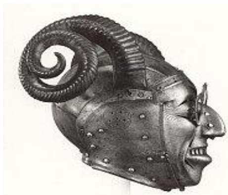
Зураг 8. Эвэртэй дуулга

Эвэр зүүх өөр нэгэн жишээ бол дархад бөө нарын ёс юм. Бөө, удганы малгайн нүүрэн талд цагаан утас, ювуугаар хүний нүүрний дүрс гаргаж, хоёр талд нь чихний дүрс гаргана. Хоёр чихний хоёр талд гурав, гурван хонгинуур уядаг, малгайн дээд ирмэгт 7-9 ширхэг бүргэдийн өд буруу талаар нь босгож хадан, хоёр талд нь буга, гөрөөсний эвэр зүүдэг (Бадамхатан, 2002: 203). Малгай дээр байгаа хүний дүрс нь Чингисийн үед бурханы шашинтай тэмцэлдэж байсан хойд зүгийн баатрынх бөгөөд эвэртэй луустай тэмцэлдэж дийлсний дурсгал болгож малгайн өдний хажуу талд эвэр хадах (Бадамхатан, 2002: 232) болжээ.