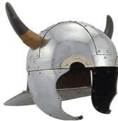
Зураг 9. Viking-ний эвэрт дуулга

Монголын үлгэр домог, туульст гунан улаан баатар далан эвэртэй морьтойгоор (Монгол ардын домог үлгэрүүд, 1984: 59), мөн дөш хар мангас далан эвэртэй догшин хар морьтойгоор (Монгол ардын баатарлаг туульс, 1982: 87) дүрслэгдсэн байдаг нь сөрөг дүрийг бүтээж буй мангасын дүрийг тод томруунаар тодорхойлохоос гадна унасан морийг далан эвэртэйгээр дүрсэлсэн нь сүр хүчийг нь тодорхойлж буй нэгэн дүрслэл болдог.