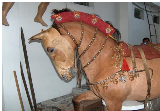
Зураг 3. Берелийн 11-р булшны адууг сэргээн засварласан байдал.

хандуулан (Ёрөөл-Эрдэнэ, 2004: 78) тавьсан байна. Мөн Гол модны оршуулгын газраас домгийн амьтан болох ганц эвэртийг дүрсэлсэн чимэглэл (Ёрөөл-Эрдэнэ, 2007: 17) олдсон (Зураг 5).