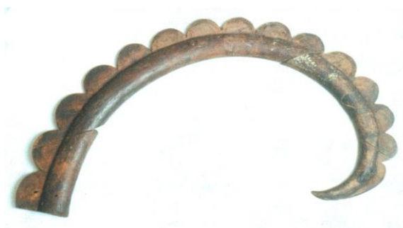
Зураг 4. Берелийн 11-р булшны адууны маскны янгирын эвэр (Горбунов, Самашев, Северский, 2005)