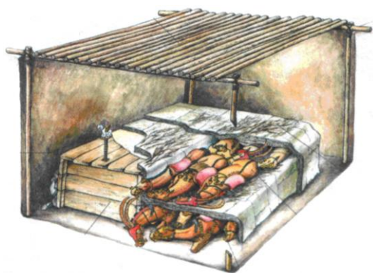
Зураг 1. Берелийн 11-р булшны дотоод зохион байгуулалтыг сэргээн засварласан байдал (Горбунов, Самашев, Северский, 2005)

Судалгааны эх хэрэглэгдэхүүнээс шүүж үзвэл хүрлийн сүүл, төмрийн эхэн үеийн дурсгал болох Казахстаны Алтайд малтан судалсан Берелийн соёлын 11-р булшинд арван гурван адууг хүнтэй нь хамт хойлголон оршуулсан байна. Адуу тус бүрийг иж бүрнээр гоёл чимэглэл зүүлгэн эмээллэснээс гадна дөрвөн адууг янгирын эвэр бүхий маск зүүлгэсэн (Горбунов, Самашев, Северский, 2005: 102) байна (Зураг 1, 2, 3, 4).