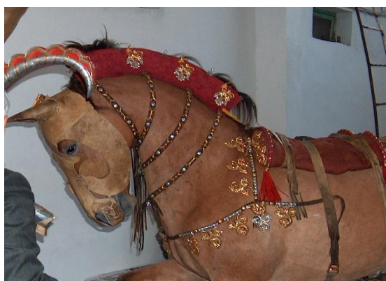
Зураг 2. Берелийн 11-р булшны эвэртэй маск зүүсэн адууг сэргээн засварласан байдал (D, Проф Д.Баярын хувийн фондоос авав).

Мөн Хүннүгийн үеийн булшнаас бугын эвэр ихээр гарч байна. Тухайлбал: Архангай аймгийн Батцэнгэл сумын нутаг дахь Худгийн толгойд малтан судалсан 1-р булшны нүхний төв хэсгээс бугын эврийн салаа гарсан (Юнь Хёнвонь, 2003: 122). Тус аймгийн Хайрхан сумын нутаг Гол модны 21С булшны баруун хэсэгт нарийн үзүүрийг нь хөрөөдөж тэгшлэн зассан бугын эврийн нэг салааг баруун хойш