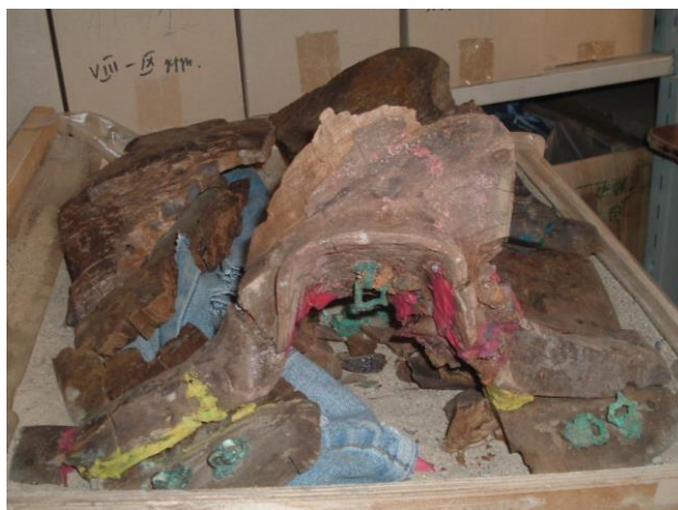
Зураг 8. Тавантолгой 9-р булш. Янгиа