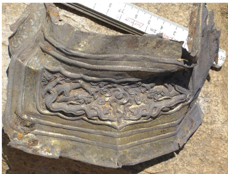
Зураг 10. Тавантолгой 10-р булш. Эмээлийн ялтсан чимэг