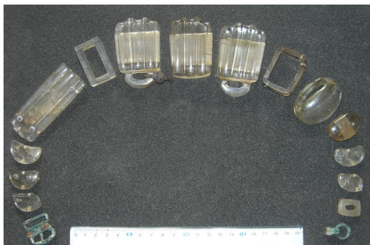
Зураг 17. Тавантолгой 11-р булш. Бүсний болор чимэг