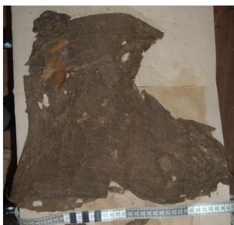
Зураг 15. Тавантолгой 11-р булш. Дээлийн хормой хэсэг, малгай