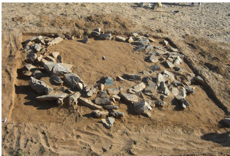
Зураг 9. Тавантолгой 10-р булш (урдаас)