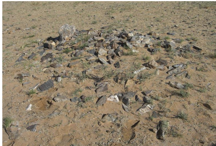
Зураг 12. Тавантолгой 11-р булш