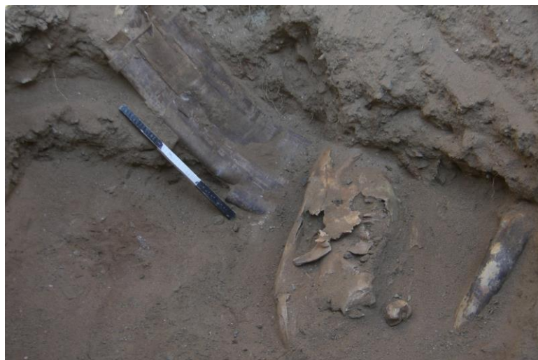
Зураг 13. Тавантолгой 11-р булш. Хоромсого, адууны толгой