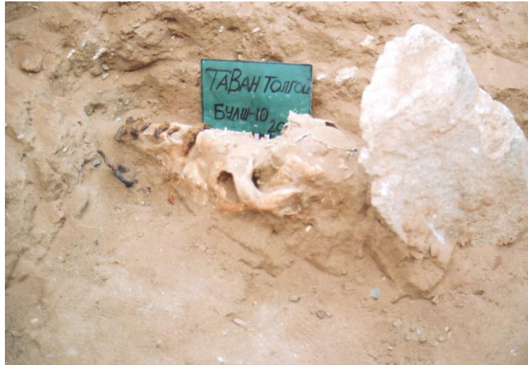
Зураг 11. Тавантолгой 10-р булш. Адууны толгой