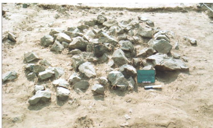
Зураг 3. Ханан бор 7-р булш (зүүн талаас)