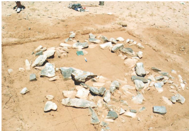
Зураг 6. Тавантолгой 9-р булш (урдаас)