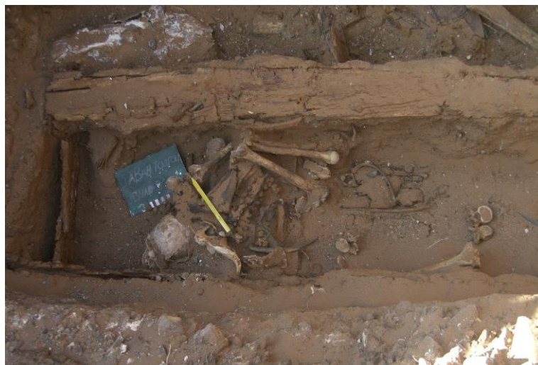
Зураг 7. Таван толгой 9-р булшны оршуулга (урдаас)