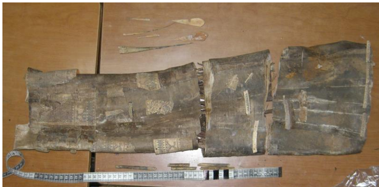
Зураг 14. Тавантолгой 11-р булш. Хоромсого