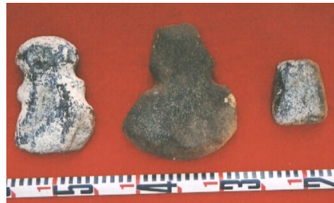
Зураг 20. Ховд Мөнххайрхан сум, Хар говийн хиргисүүрээс олдсон чулуун зэвсэг