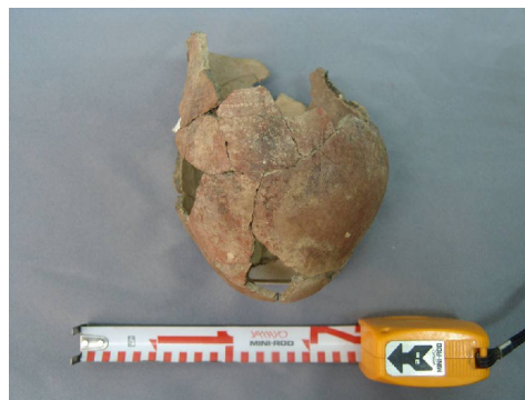
Зураг 4. Афанасевийн булшны өндгөн ёроолтой ваар