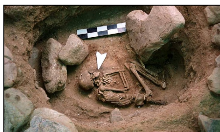
Зураг 10 Ховд Мөнххайрхан сум Улаан говийн үзүүрийн 1-р булшны оршуулгын зан үйл