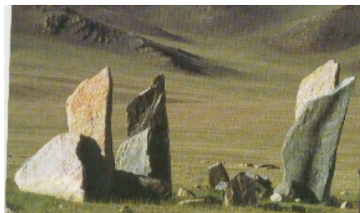
Зураг 25. Буган хөшөөтэй дөрвөлжин булш