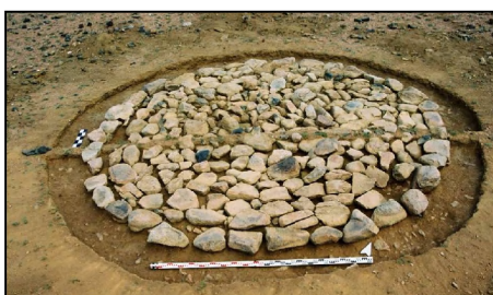
Зураг 9 Ховд Мөнххайрхан сум, Улаан говийн үзүүрийн 1-р булш