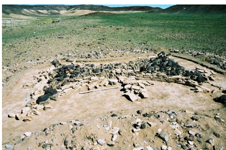
Зураг 26. Шоргоолжин булш