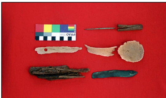
Зураг 11. Ховд Мөнххайрхан сум, Улаан говийн үзүүрийн 1-р булшнаас олдсон хүрэл хутга, зүү, ясан халбага