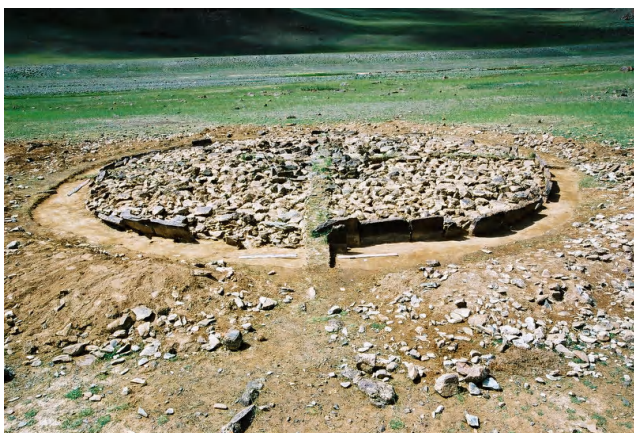
Зураг 1 Баян-Өлгий аймаг Улаанхус сум Афанасевийн булш

түүнийгээ чулуун дараасаар тэгш хавтгайлан тавцан маягаар дүүргэсэн булшинд хүнээ төв хэсэгт нь гүн биш нүхэнд тавьж хавтгай нимгэн чулуугаар хашлага хайрцаг хийж тавьдаг зан үйл бүхий булш Алтайн уулсын ам салаа болгоноос урсан гарч буй том жижиг голын хөндийгээр нилээд элбэг тархсан байдаг. Ийм дөрвөлжин хүрээтэй, газар дээр гүн нүх ухаж, голдоо хавтгайдуу өндөр биш чулуун дараас хийн хүнээ оршуулсан зан үйл бүхий булшийг үүнээс өмнө зарим судлаачид Завхан аймгийн Тосонцэнгэл сумын нутагт малтан шинжилсэн байна (Коновалов и др., 1995).