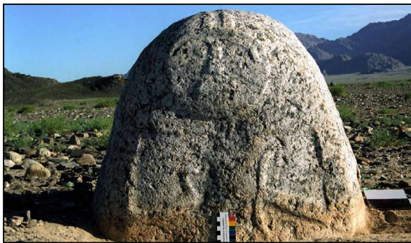
Зураг 7 Ховд Булган сум, Ягшын хөдөө 1-р булшны хүн чулуун хөшөө