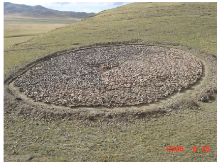
Зураг 12 Хөвсгөл Арбулаг сум Галбаагийн үзүүрийн булш