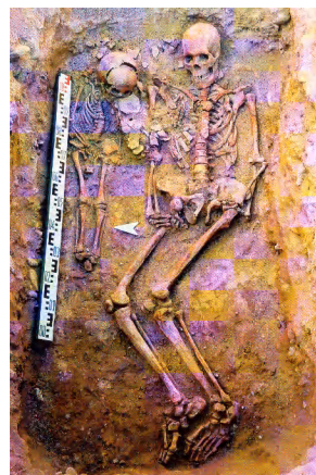
Зураг 2 Афанасевийн булшны оршуулгын зан үйл