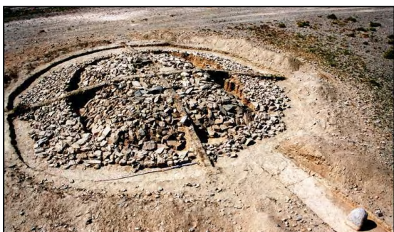
Зураг 5 Ховд Булган сум Ягшийн хөдөө, Чемурчекийн соёлын 1-р булш