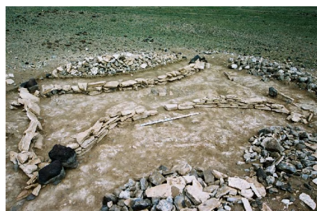
Зураг 27. Шоргоолжин булшны хашлага