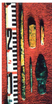
Зураг 3. Афанасевийн булшнаас олдсон хүрэл болон ясан эдлэлүүд