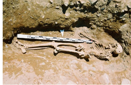
Зураг 16 Ховд Мөнххайрхан сум, Хар говийн Буган чулуун хөшөөтэй хиргисүүр