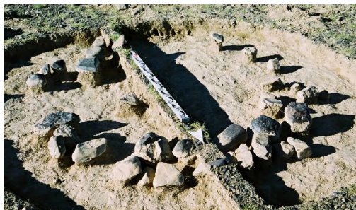
Зураг 22 Ховд Үенч сум Байтагийн булш