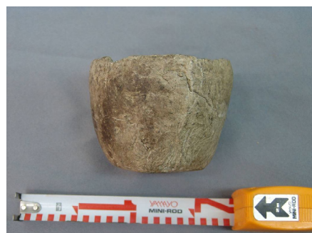
Зураг 6 Ховд Булган сум 3-р булшнаас гарсан чулуун аяга