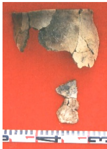
Зураг 19. Ховд Мөнххайрхан сум, Хар говийн хиргисүүрээс олдсон ваарны хагархай