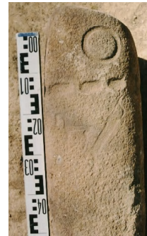
Зураг 18. Ховд Мөнххайрхан сум, Хар говийн хиргисүүрээс олдсон буган хөшөө