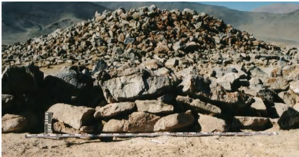
Зураг 17. Ховд Мөнххайрхан сум, Хар говийн хиргисүүрийн хажуугийн байдал