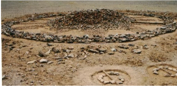
Зураг 15. Ховд Мөнххайрхан сум, Тэлэнгэдийн амны хиргисүүрийн оршуулгын зан үйл