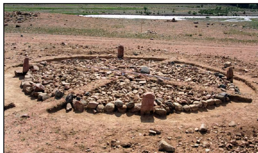
Зураг 14 Ховд Мөнххайрхан сум Хөх толгойн 2-р булш