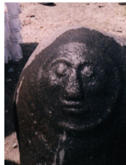
Зураг 8 БНХАУ-ын Алтайн аймгийн нутаг дахь Чемуракеийн соёлын хүн чулуун хөшөө