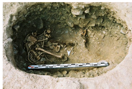
Зураг 23 Ховд Үенч сум Байтагийн булшны оршуулгын зан үйл