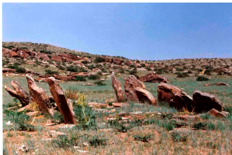
Зураг 24. Дөрвөлжин булш