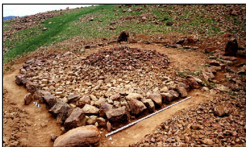
Зураг 13. Ховд Мөнххайрхан сум Хөх толгойн 1-р булш