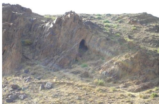
Зураг 1. Их Өвгөн уулын агуй

Өмнөговь аймгийн Номгон сумын төвөөс зүүн хойш 30 км орчим зайд орших Өлзийтийн талын хойд захыг эмжин өргөргийн дагуу 10-аад км сунаан тогтсон хадархаг уулыг Их Өвгөн уул гэж нутгийнхан хүндлэн дууддаг аж. Энэ бүс нутаг нь Монгол орны физик газар зүйн мужлалын хувьд Говийн их мужын Умарт говийн ухаа, гүвээг талын тойрогт хамаарагдана (Монгол орны физик газар зүй, 1969: 384, 398). Их Өвгөн уулын амууд олон сайр болон салаалах бөгөөд тэдгээрийн хоорондох тэгш дэвсгүүд, сайруудын эргээр эрт үед холбогдох олон зуун археологийн дурсгалууд тохиолдоно.