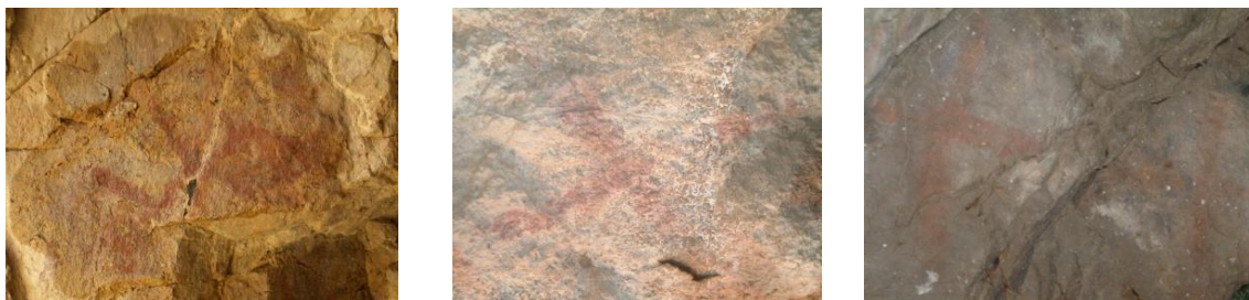
Зураг 2. Их Өвгөн уулын агуйн зосон зураг

Агуйн зосон зургууд бүгд баруун талын хананд байх бөгөөд энд улаан зосоор зурсан нийт 5 дүрс мэдэгдэж байв (Зураг 2). Эдгээрийг үүдэн талаас нь эхлэн дугаарлан тодорхойлбол: 1 дэх дүрс агуйн өнөөгийн гэрэлт түвшнээс 1,6 м өндөрт байх бөгөөд нилээд хэсэг нь бүдгэрч арилан тодорхой мэдэгдэхээ больсон байна. 2 дахь дүрс болох 9 см өндөртэй чагтан тэмдгийг эхний дүрсээс хойш 5 см зайд зуржээ. Үүнээс хойш 1,3 м зайд гэрэлт түвшинээс 1,2 м өндөрт 3, 4 дэх чагтан