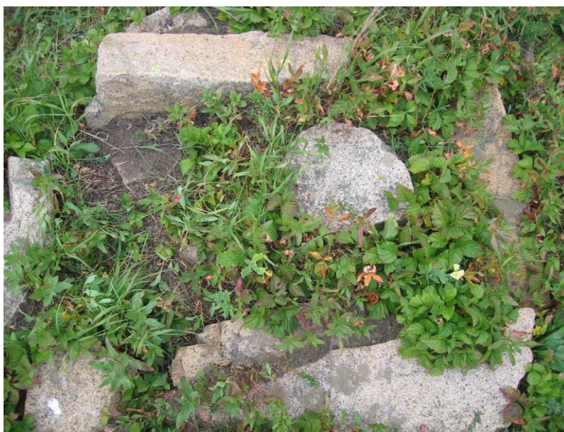
Зураг 3а. Өвөрхангай, Хужирт, Дулаанхайрханы өвөр, Тахилын онгоны бүрэлдэхүүн хэсэг Хүн чулуун хөшөөний суурь бүхий хашлага чулууны гэрэл зураг