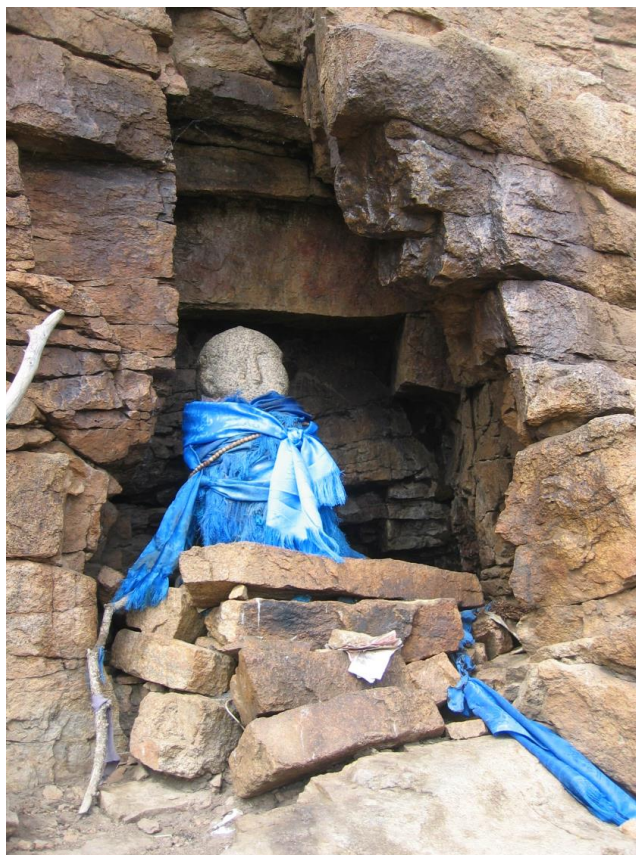
Зураг 2а. Өвөрхангай, Хужирт, Дулаанхайрханы өвөр, Хүн чулуун хөшөөний гэрэл зураг