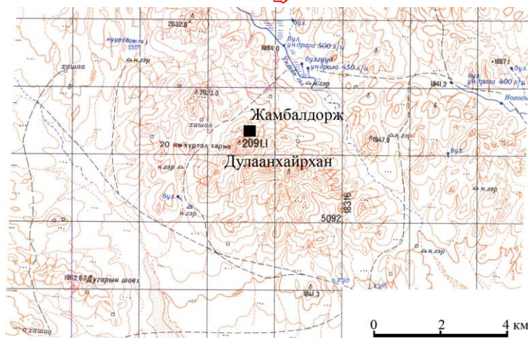
Зураг 1а. Монгол улс, Өвөрхангай аймаг, Хужирт сум, Дулаанхайрхан, Жамбалдорж