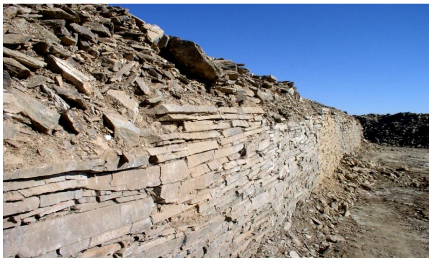
Зураг 3. Булины зүүн хана