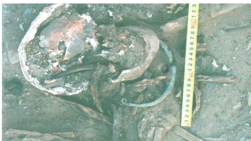
Зураг 10. Шивээт овоо. 2-р були. Хүзүүн дэх С хэлбэрийн хүрэл эдлэл