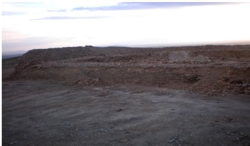
Зураг 2. Баруун талаас авсан зураг