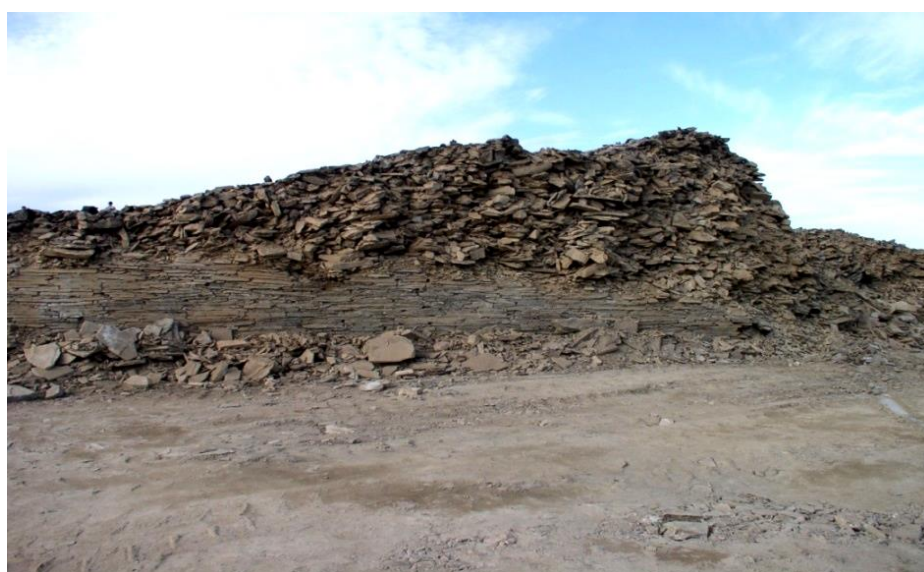
Зураг 4. Булины зүүн хойд өнцөг