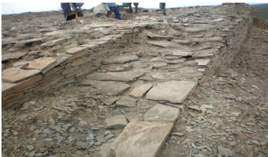
Зураг 5. Булины баруун ханын давхарлаж өрсөн хэсгийг цэвэрлэсний дараах байдал