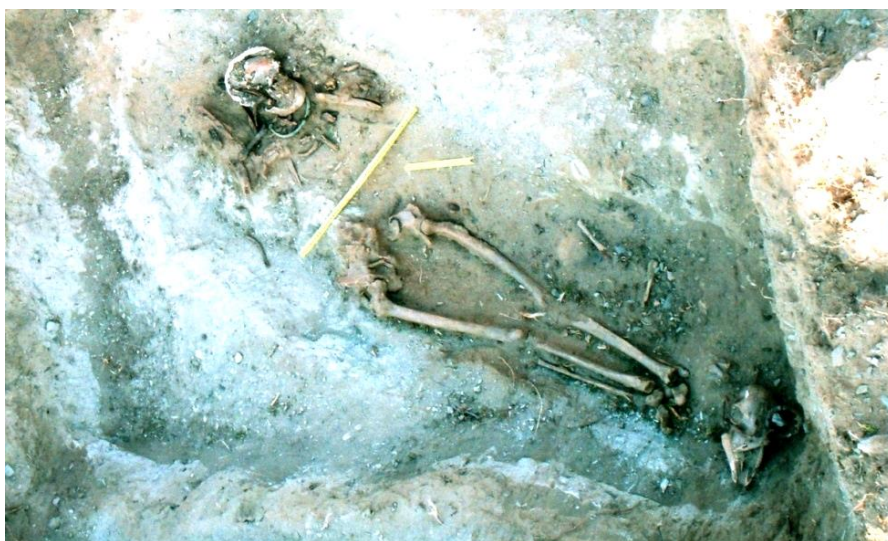
Зураг 8. Шивээт толгой. 2-р були