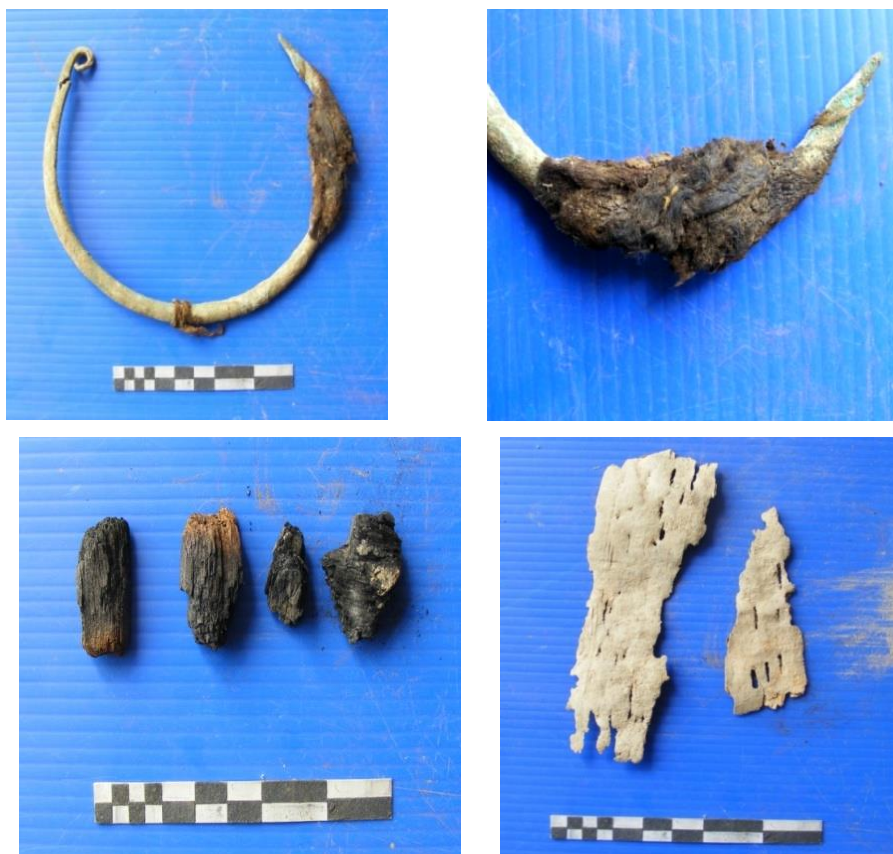
Зураг 11. Хашиатын Шивээ толгойн 2-р булнаас гарсан С хэлбэрийн хүрэл эдлэл, нүүрс, үйсний хэсэг

Ясны хадгалалт дунд зэрэг, хүйс болон зүг чигийг тогтоох боломжгүй. Тэрчлэн хэд хэдэн удаа тоногдож, булшны дотоод зохион байгуулалт, нүхний хэлбэр бүхэлдээ эвдэрсэн бөгөөд түүнийг дагуулан малтахад дээрхийн адил энд тэндээс төмөр хутга, 4 талт хуяг нэвтлэгч зэв, хавтгай зэв, жижиг, дугуй төмөр арал, модны наалдацтай төмөр хадаасууд дахин гарсан юм. Булшны нүхний хэмжээ урт нь ойролцоогоор 220 х 150 см. Булшнаас олон тооны модны наалдацтай төмөр хадаас олдож байгаагаас үзвэл модон австай байсан бололтой. Гэвч авс байсныг батлах модон хийц огт байсангүй. Иймэрхүү маягийн төмөр хадаас Сүхбаатар аймгийн Мөнххаан сумын Ачаат уул, Асгат сумын Шарга уул зэрэг газраас гадна оросын Чита мужийн Оловянная өртөөний орчим малтсан дундад эртний монгол булшнаас олдож байжээ (Ковычев, 1988:137). Дурдсан хэв шинжийн зэвүүд нь Монгол, Өвөр Байгаль болон Казахстан зэрэг газар нутгийн XIII-XIV зууны үеийн археологийн дурсгалуудаас түгээмэл олддог зэр зэвсгийн зүйл юм.