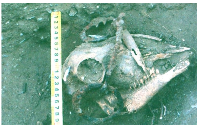
Зураг 9. Шивээт овоо. 2-р були. Хонины толгой дээр тавьсан төмөр амгай