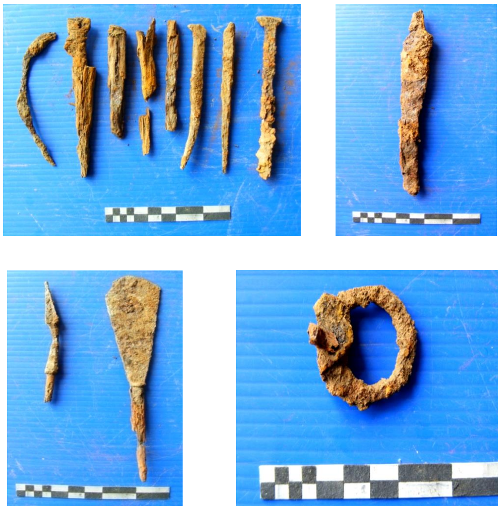
Зураг 7. Хашиаатын Шивээ толгойн 1-р булинаас гарсан авсны төмөр хадаас, зэв, хутга болон гархи

1-р булш. Талбайн дээд хэсэгт орших 450 х 390 м хэмжээтэй, зөв бус зууван дугуй хэлбэртэй, булшны гадаад байгууламж зарим хэсэгтээ багагүй эвдэрч, өөрчлөгджээ. Чулуун дараасыг авсны хойно талбайн төвд цэвэрлэж үзэхэд уртрагийн дагуу тодорхой хэлбэр дүрсгүй нүх гарсан бөгөөд 90 см гүнд хүний гавлын хэсэг болон мөчдийн яснууд энэ тэндээс гарч эхэлсний зэрэгцээ 4 талт төмөр хадаас, төмөр зэв, үйсний хэсэг зэрэг эд өлгө тодорхой байрлалгүй, янз бүрийн газруудаас гарлаа.