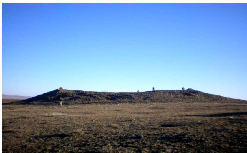
Зураг 1. Шивээ толгойн були

Уг дурсгал нь Хөшөө Цайдамаас 3 км орчимд байгаа нь дээрх хоёр дурсгал нэгэн цаг үед холбогдох нь эргэлзээгүй бөгөөд тэдгээрийн хооронд ямар нэг шууд харилцаа холбоо байж болохоос ба бидний урьдчилан таамаглаж байгаагаар Зүүн Түрэгийн жанжин 731 онд нас барсан Культегин, 734 онд нас барсан Билгэ хаан нарын бунхант оршуулга байж болох талтай. Тэднийг нас барахад хятадын Тан улсын эзэн хаан Сюань Цзун өөрийн гараар бичсэн эмгэнэлийн захидлыг элчээр дамжуулан илгээхийн зэрэгцээ оршуулгын ажилд оролцох урчууд болон 500 цэргийг илгээсэн бөгөөд Культегин, Билгэ хаан нарт зориулсан тахилгын байгууламжуудыг ойролцоогоор нэг жилийн дараа дуусгаж, ёслол, төгөлдөр нээж байжээ. Энэхүү томоохон оршуулгын болон тахилгын байгууламжийг барьж, байгуулахад Хөх түрэгийн олон ард иргэд ихээхэн хүчин зүтгэл гаргасан нь дээрх байгууламжуудын цар хэмжээнээс харагдаж байна. Нөгөө талаас судлаачдын дунд хаад язгууртнуудыг чандарладаг байсан мэтээр ойлгосоор иржээ. Гэтэл руни бичгийн зарим дурсгалд тухайлбал Ар ханангийн түрэг бичээст Күл-тархан ноёныг нас барахад эртний нүүдэлчдийн заншил ёсоор хойлог хийж оршуулсан тухай өгүүлдэг бол (Л.Болд, 1990:17), Куль-чурт босгосон гэрэлт хөшөөний бичээсний 24-р мөрөнд “...чур тегин, түүний хойноос дөрвөн тегин ирж Ышбара цэцэн Кул-чурыг оршуулсан...” гэжээ. Энд оршуулсан гэж зориуд цохон тэмдэглэснийг бодвол тухайн үеийн зан заншилыг мэдэхэд чухал хэрэглэгдэхүүн болох нь эргэлзээгүй (Л.Болд, 1990:40-43).