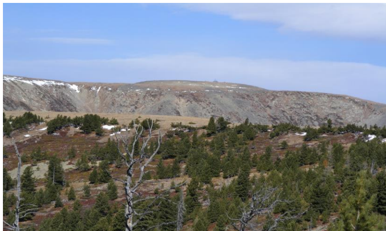
Зураг 1. Тэнгэрийн овоо. 2-р дэвсэг дээрээс авсан зураг

хирийн болсон гэдэг нь дахин төрөхийг ёгт байдлаар илэрхийлсэн байна. Юу ч атугай Их хааны шарилыг олон хоног сарын турш энгийн байдлаар хадгалан эх нутагт хүргэж ирсэн гэж үзэх нь хэтэрхий гэнэн ойлголт болох нь тодорхой юм.