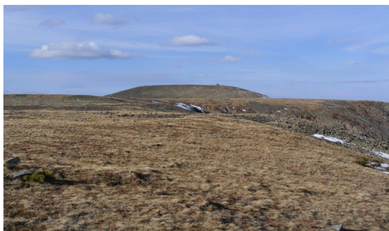
Зураг 2. 4-р дэвсэг дээрээс авсан зураг