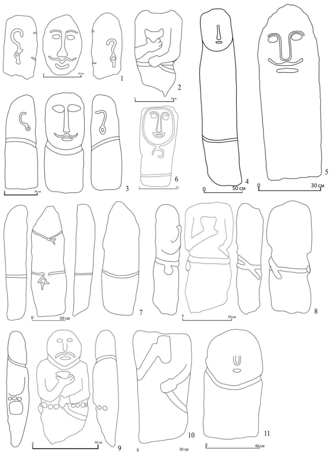
Зураг 2. 1. Бэлчирийн хоолын 1-р хүн чулуу; 2. Бэлчирийн хоолын 2-р хүн чулуу; 3. Дөмөөн хаварзаны хүн чулуу; 4. Заан хамарын хүн чулуу; 5. Пайз толгойн 1-р хүн чулуу; 6. Пайз толгойн 2-р хүн чулуу; 7. Тэмээн чулууны хүн чулуу; 8. Хавтгай сээрийн 1-р хүн чулуу; 9. Хавтгай сээрийн 2-р хүн чулуу; 10. Хар толгойн 1-р хүн чулуу; 11. Хар толгойн 2-р хүн чулуу

хашлаганы хэмжээ 235x205 см. Уг хүн чулуу нь бүрэн дүрслэлтэй.