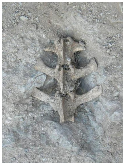
Зураг 3. Өмнөговь аймаг, Номгон сум, Цагаантолгой. 4-р булш

Өнөө хүртэл хуримтлагдсан судалгааны бүтээлүүдийг ажиглахад бог малын нуруу дагалдуулах зан үйлийн талаар ямар нэгэн санал, таамаглал судалгааны дүгнэлт хомс байна. Иймд уг зан үйлийн уламжлал, харилцаа холбоо, утга агуулга, билэгдэл зэргийг тодруулах үүднээс түүхэн бусад үеийн дурсгалуудад ажиглагддаг түүнтэй холбоотой байж болох зарим шинжүүдийг авч үзье.