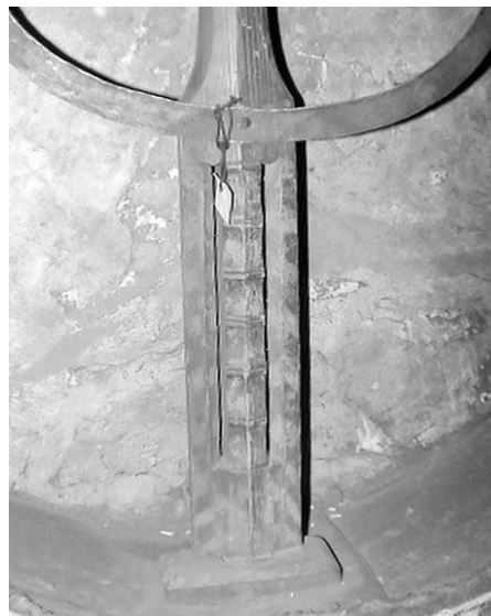
Зураг 7. МҮМ-н сан хөмрөгт байгаа бөөгийн хэнгэргийн бариул дээрх дүрслэлүүд