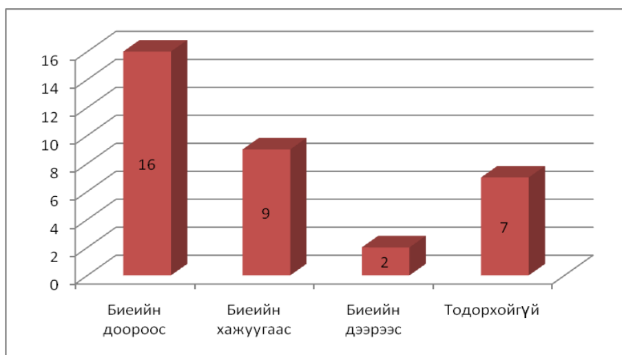
Зураг 1. Нүүдэлчдийн оршуулганд малын нурууны ясны илэрсэн байрлал (булшны тоогоор)

Оршуулганд дагалдуулсан нурууны тооны хувьд нэг нугалмаар 2, хоёр нугалмаар 10, гурван нугалмаар 11, болон долоон нугалмаар 1 удаа (нурууг 3 болон 4 үеэр нас барагчийн зүүн болон баруун шууны хажуу талд тавьсан) (Зураг 2) илэрснээс үзвэл хоёр болон гурван үе нугалмууд давамгайлж байна. Есөн тохиолдолд дагалдуулан тавьсан нурууны тоог тодорхой дурдаагүй байна. Харин нас хүйсийн ялгаа ажиглагдахгүй байгаа ба бүс нутгийн ялгаа бага зэрэг ажиглагдаж байгаа ч цаашдын малтлага судалгаагаар тодруулах боломжтой юм. Тухайлбал: Эгийн голын булшинд 2 нугалам нуруу давамгайлж байхад Дорнод аймгийн Гурванзагал сумын Цагаан чулуут, Дорноговь аймгийн Дэлгэрэх сумын Чандмань хар уул зэрэг бүлэг оршуулгатай газрын булшнуудад гурван нуруу тавиад дээрээс нь нас барагчийг тавьж оршуулсан тохиолдол давамгайлж байна. Өмнөговь аймгийн Номгон сумын Цагаантолгойн 4-р булшинд талийгаачийг оршуулахын өмнө нүхний доторх хадыг хонхойлгон ухаж бог малын гурван нугалам нурууг малд байрлах хэлбэрээр нь тавиад дээрээс нь хүнээ оршуулсан байсан бол (Түмэн нар 2008), (Зураг 3) Сонгино хайрхан уулын 2-р булшны нүхнээс бог малын 3 үе нуруунаас өөр хүний болон малын яс, эд өлгийн зүйл гараагүй (Наваан, Эрдэнэ 2008) байна. Эдгээрээс үзвэл эртний нүүдэлчид оршуулганд бог малын нурууг дагалдуулахдаа ихэвчлэн нас барагчийн нурууны тушаа, газар хонхойлгон ухаж байрлуулаад дээрээс нь хүнээ тавин оршуулдаг, дагалдуулах нурууны тоо зэргээс үзвэл энэ нь тогтсон зан үйл байсан бололтой.