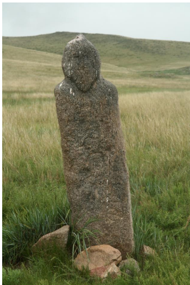
Зураг 2. Худагтын хүн чулууны гэрэл зураг