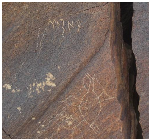
Зураг 6. Далтын ууланд олдсон руни бичээс