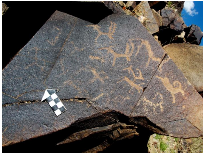
Зураг 4. Далтын талбайн хадны зураг. Янгирын сүрэг, аргал, махчин амьтан