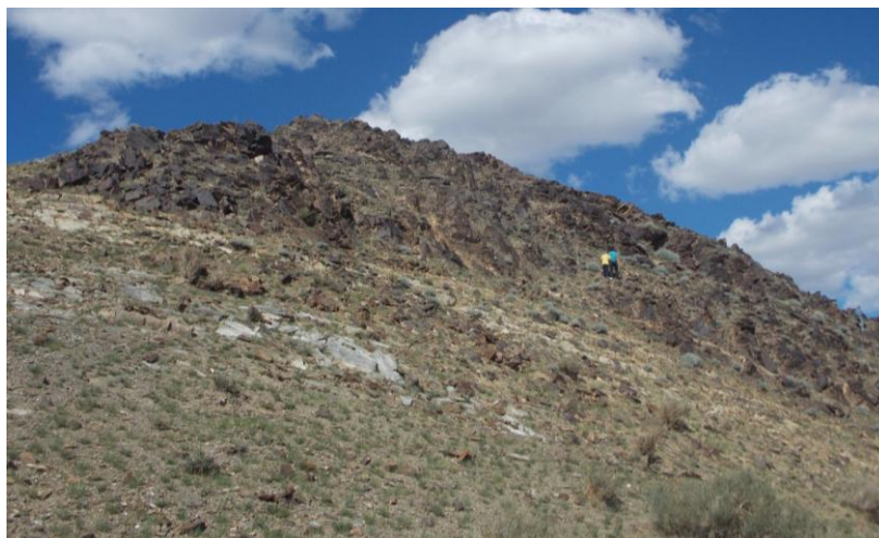
Зураг 1. Баянхонгор аймгийн Бөмбөгөр сумын нутаг Далт уулын хадны зураг бүхий хэсэг

Цэвээндорж Д., Цэрэндагва Я. 2005. Баянхонгор аймгийн нутаг дэвсгэрээс олдсон хадны зургийн зарим дурсгалаас. SA. Т. XXIII, f. 2, УБ., х. 16-31