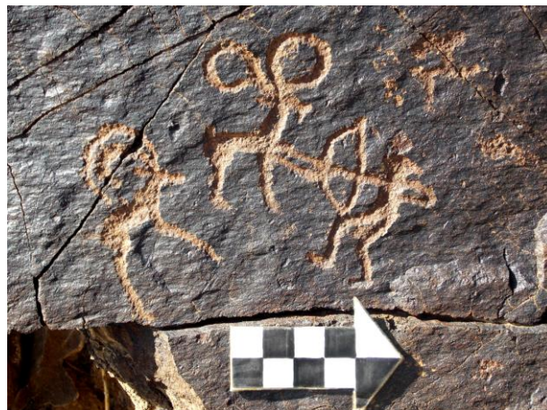
Зураг 5. Далт уулын хаданд дүрсэлсэн ан хийж буй хүн, янгир