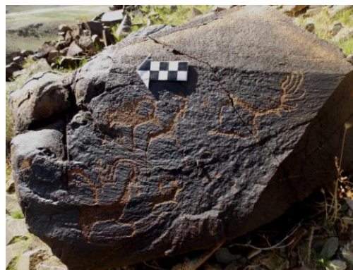
Зураг 2. Далт уулын хаданд дүрсэлсэн янгир, аргаль, олон салаа эвэртэй буга